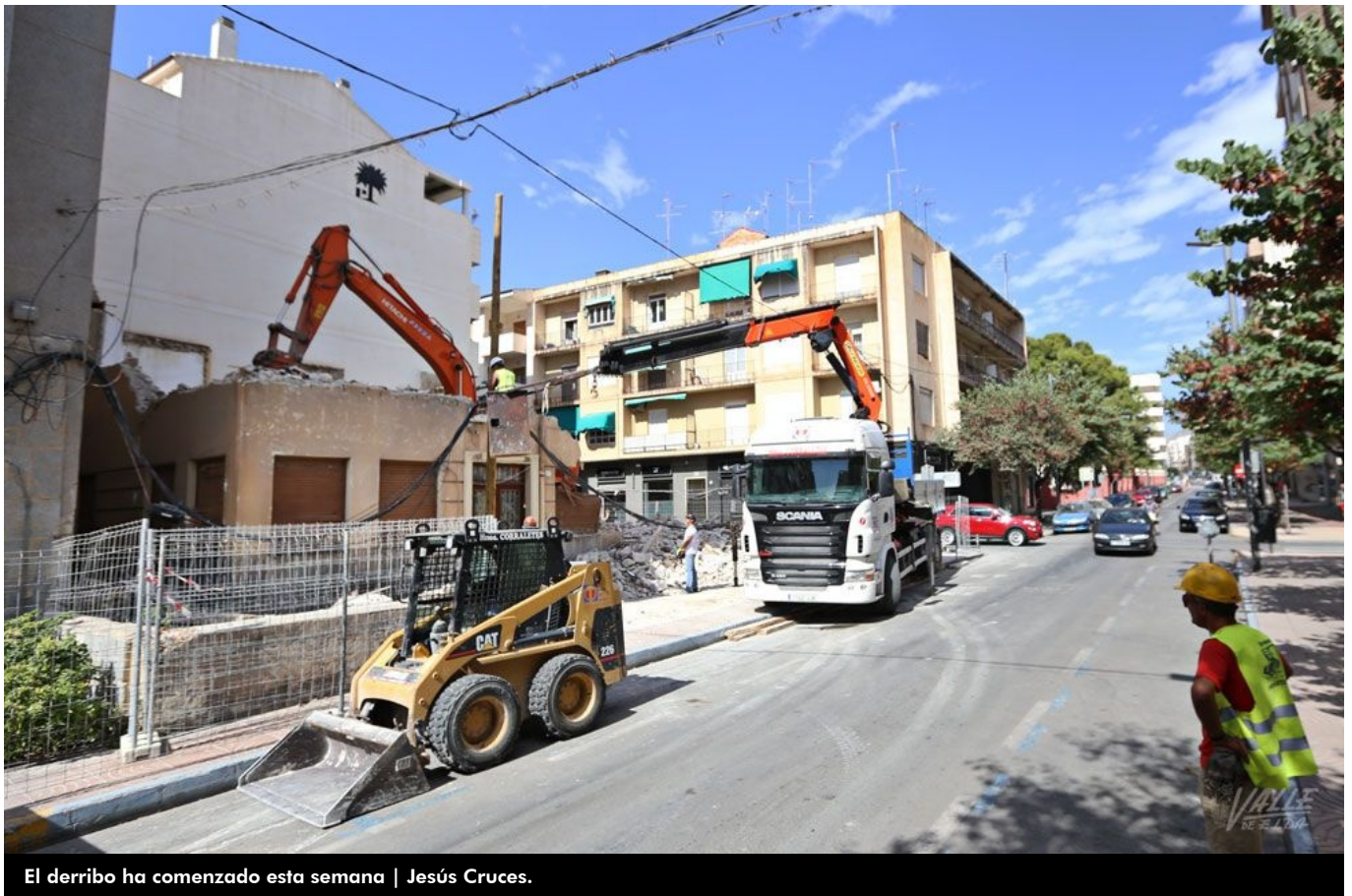
El derribo ha comenzado esta semana

La calle Padre Manjón pierde dos viviendas catalogadas como Patrimonio Arquitectónico Civil dentro del Catálogo de Bienes Inmuebles del Ayuntamiento de Elda. Estas edificaciones, ubicadas en los números 37 y 39, están siendo derribadas para realizar una nueva construcción. Dada su situación céntrica y en una zona rodeada de grandes edificaciones, estas casas llamaban la atención: eran unifamiliares y con patio delantero, siguiendo el modelo de construcción de los años 40 . Ahora solo queda una de características similares, ubicada en el número 13 de la misma calle, que refleja cómo se edificaba en la época de posguerra en la ciudad.