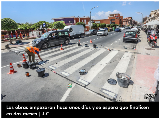
Las obras empezaron hace unos días y se espera que finalicen en dos meses | J.C.