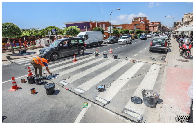
Las obras empezaron hace unos días y se espera que finalicen en dos meses