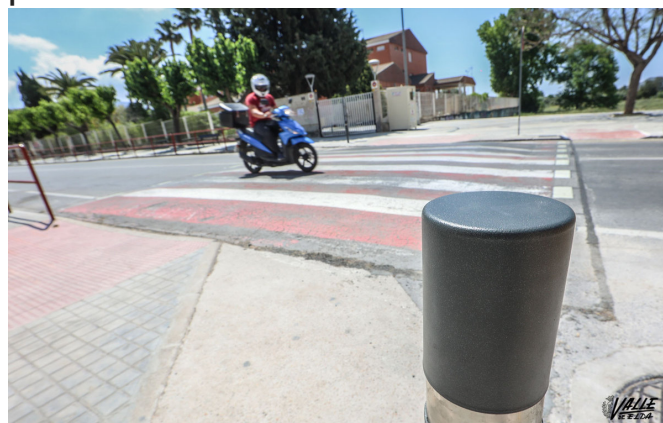
Unos sensores advierten de que la persona se acerca al paso de peatones