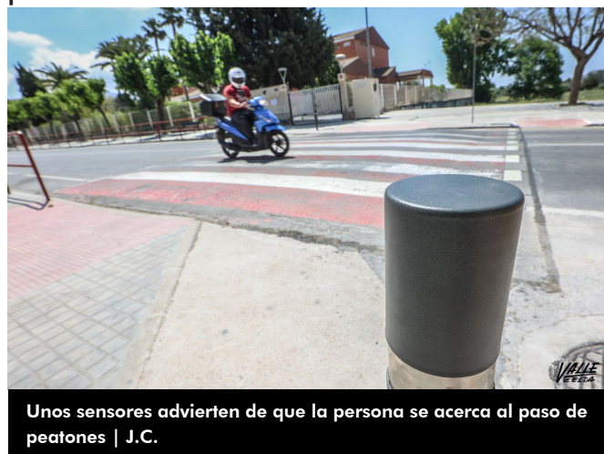
Unos sensores advierten de que la persona se acerca al paso de peatones