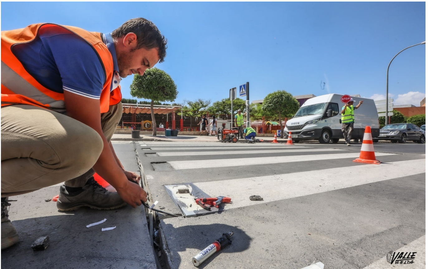
Cuatro de los seis peatones inteligentes estarán situados a la altura de centros escolares