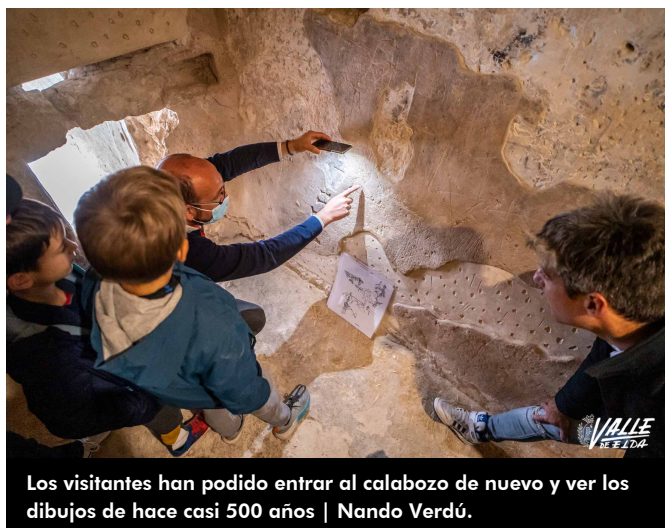
Los visitantes han podido entrar al calabozo de nuevo y ver los dibujos de hace casi 500 años

Tendero ha detallado que en su construcción, los musulmanes ubicaron este espacio bajo la torre como depósito de agua y que los cristianos lo reconvirtieron en un calabozo . Además ha mostrado a los pequeños grupos que iban entrando por su diminuta entrada los dibujos que hicieron los presos como un calendario, letras árabes e incluso la cruc papal, soldados o una escena de caza del siglo XVI .