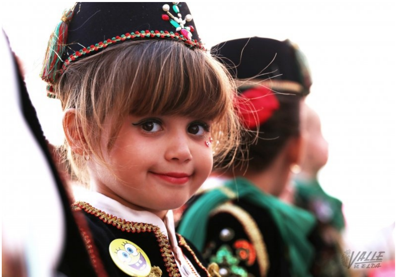
Los pequeños han desfilado con alegría por las calles de Petrer | Jesús Cruces.

Las fiestas de Moros y Cristianos de Petrer han dado el pistoletazo de salida ya que, aunque comenzarán oficialmente el próximo jueves 11 de mayo, hoy han llegado dando el protagonismo a los más pequeños con el Desfile Infantil y el posterior Homenaje a las Rodelas del año 2016. Cientos de niños han protagonizado este primer desfile de las fiestas de 2017 , en el que con su alegría, soltura y desparpajo, los niños han despertado los aplausos del público, que ha llenado las calles del casco histórico para verlos.