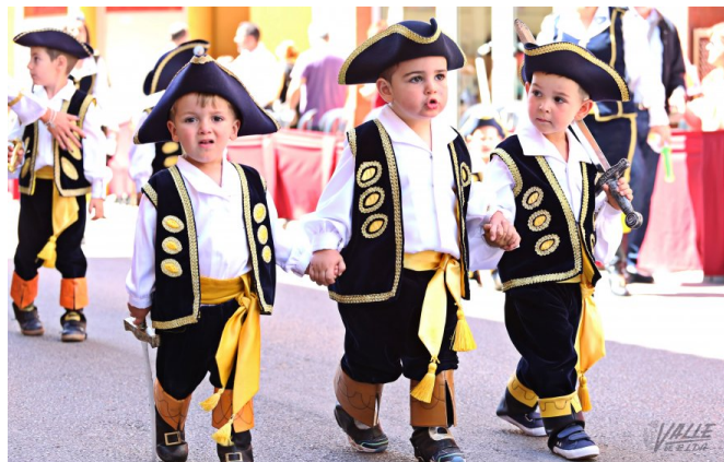
Desde corta edad los pequeños forman parte de las fiestas | Jesús Cruces.

Tras el desfile ha dado comienzo la 30ª edición del Homenaje a las Rodela, un merecido tributo a las pequeñas que se ha celebrado en un repleto Teatro Cervantes con la representación teatral donde una mujer y una niña hablaban de sus sentimientos festeros como rodela, una experiencia que ambas habían vivido a pesar de la diferencia de edad. También se mostró un vídeo en el que se mostraron imágenes de rodela de las últimas décadas. Las pequeñas protagonistas de las pasadas fiestas entregaron finalmente el escudo a sus sucesoras.