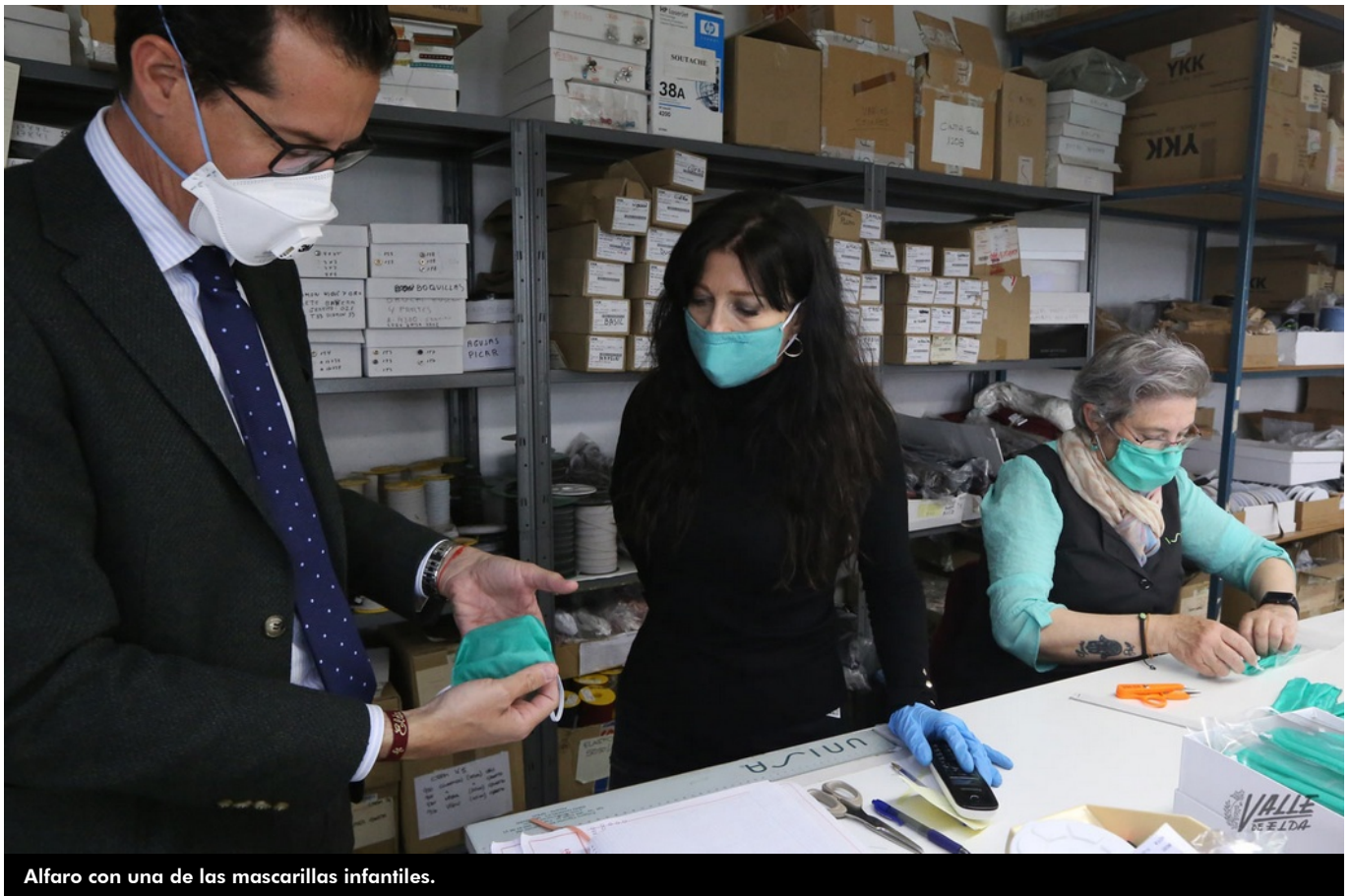
Alfaro con una de las mascarillas infantiles.

El alcalde de Elda, Rubén Alfaro , ha firmado hoy mismo un bando para que se realice un reparto masivo de mascarillas reutilizables entre todos los eldenses . En total se distribuirán 44.000 unidades . La entrega comenzará el próximo miércoles 29 de abril y se alargará hasta el 8 de mayo , en días laborables en horario de 9 a 14 horas . Las mascarillas no solo serán para los menores de hasta 14 años sino también para toda la población hasta 64 años , pues a los mayores de 65 se las entrega la Generalitat Valenciana.