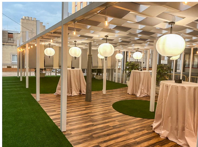
Se encuentran en la plaza de La Ficia.