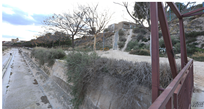
Los vecinos solicitaban la mejora de la zona por seguridad | Jesús Cruces.

Estas escaleras tienen casi 20 años , y cada poco tiempo necesitan que se remoce la zona, puesto que crece la mala hierba alrededor y cuando llueve la tierra hace que se pierda la arena que la rodea.