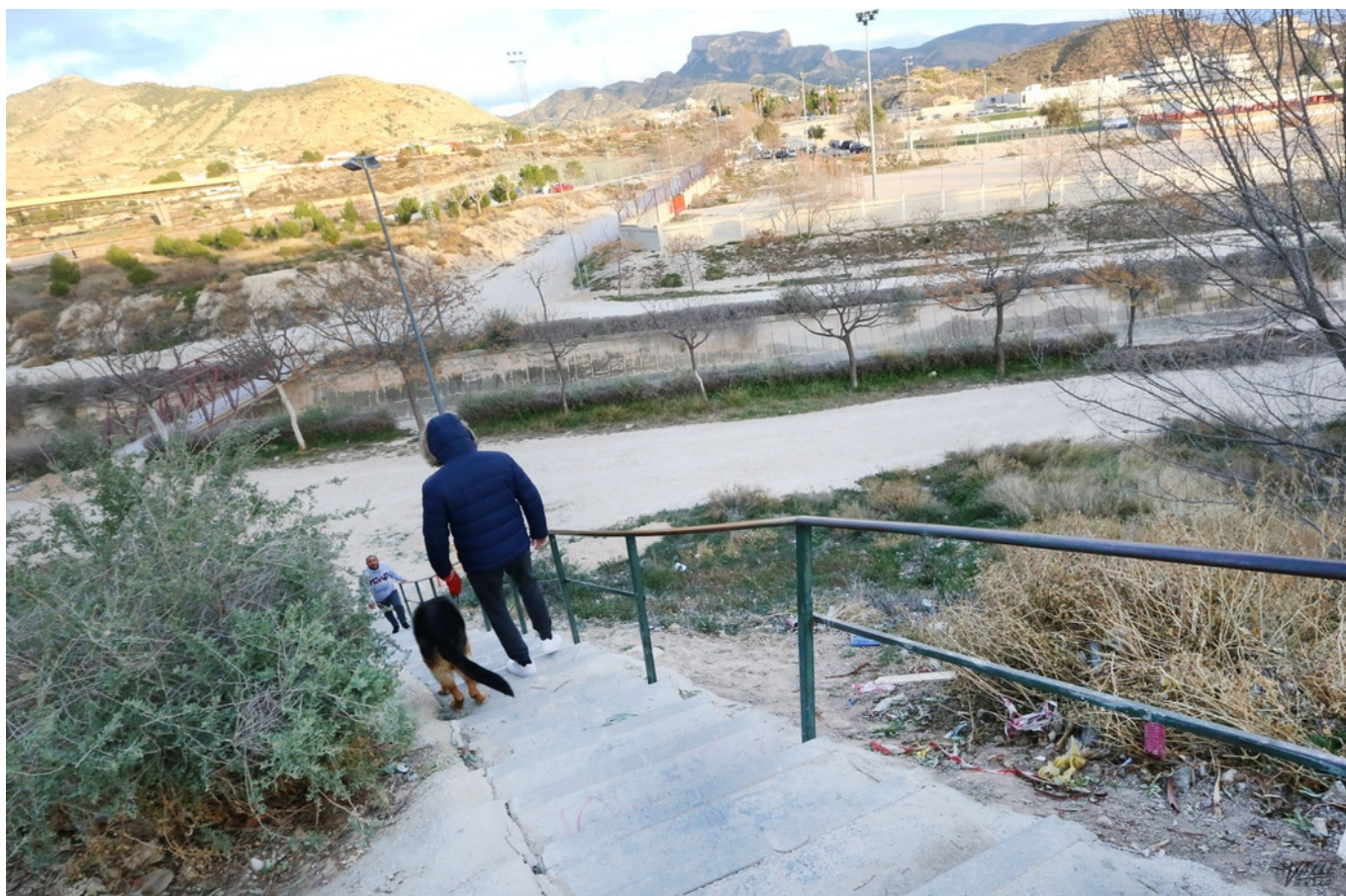
Numerosos vecinos utilizan esta escalera a diario | Jesús Cruces.

La empinada escalera que conecta el barrio Huerta Nueva con las instalaciones deportivas de la Sismat así como con la avenida de la Mora y el puente de la Libertad ha sido mejorada por el Ayuntamiento de Elda , a través de la Concejalía de Inversiones y Obras. También se han colocado puntos de luz en la pasarela que cruza el río , de esta forma se da respuesta a una demanda de los vecinos que llevan años solicitándolo por motivos de seguridad .