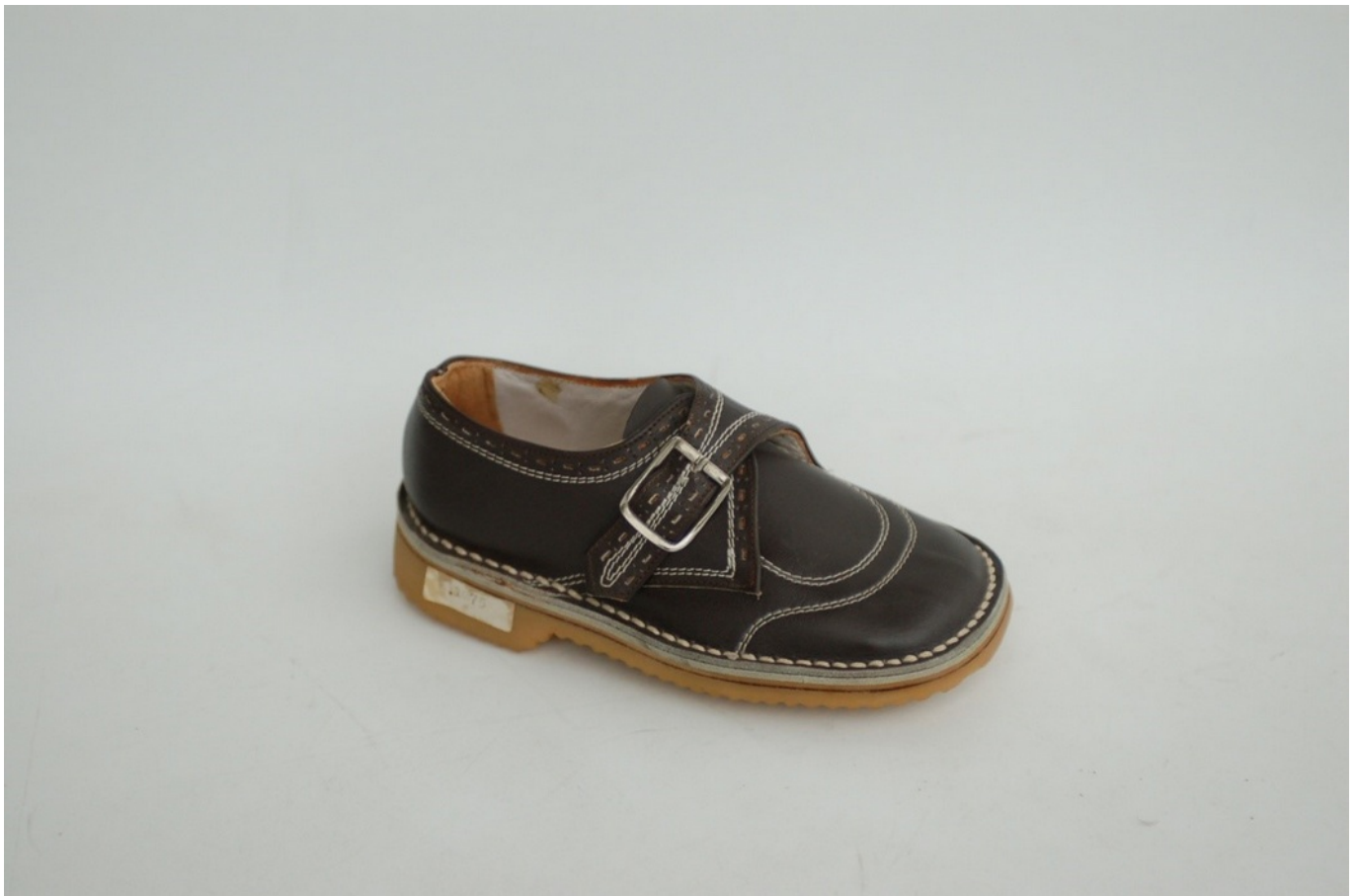
Zapato tipo blucher de niño fabricado en Elda | Museo del Calzado

Todas estas marcas de fábrica correspondían exclusivamente a zapatos para niños. Hemos dicho muchas veces que quizás el inicio de la fabricación de calzados en Elda empezó por el calzado de niño, esa suposición parte de una lógica reflexión: En aquellos años de 1840 cuando se supone que aparecen los primeros talleres artesanales, los zapatos que de confeccionaban en las habitaciones de las casas del casco antiguo de la ciudad, precisaban de hormas que , al no existir fábricas de hormas, se tenían que hacer a mano. Aquellos primeros zapateros eldenses eran también tallistas de madera, para poder hacer la horma