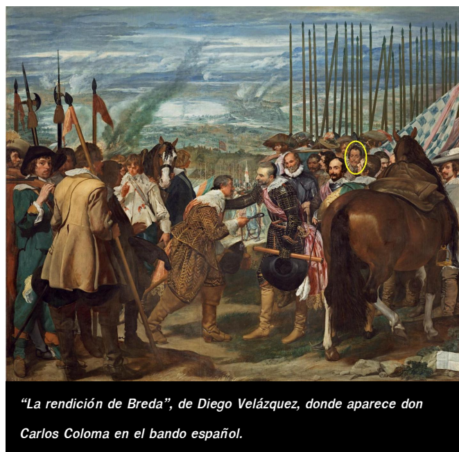
"La rendición de Breda", de Diego Velázquez, donde aparece don Carlos Coloma en el bando español.

Carlos Coloma quedará inmortalizado por el maestro Diego Velázquez en el cuadro "La rendición de Breda" en la que participó activamente al frente de los tercios españoles