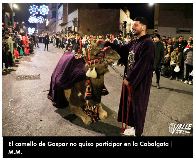
El camello de Gaspar no quiso participar en la Cabalgata | M.M.

Esta Cabalgata, organizada por la Concejalía de Fiestas, se llevó a cabo con la colaboración de la Junta Central de Comparsas de Moros y Cristianos, Junta Central de Fallas, Junta Mayor de Cofradías y el Centro Excursionista Eldense, por ello, en el desfile participaron bandas de algunas Cofradías como la de Medinaceli o El Perdón, así como el Sotavento Pirata. La banda eldense Baloo's Band también se está haciendo un hueco en las principales actividades locales y actuó en la Cabalgata centenaria.