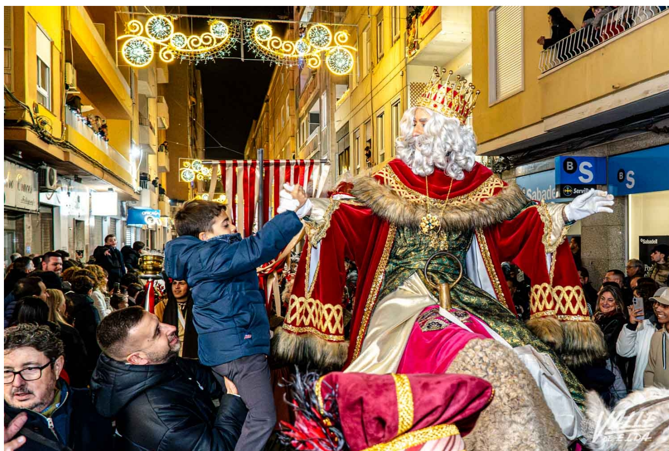
Los Reyes Magos conocieron a los niños eldenses | Nando Verdú.

La Cabalgata de los Reyes Magos volvió a dejar sin palabras a los eldenses. Tanto niños como mayores disfrutaron de un gran espectáculo visual y sonoro que contó con una decena de carrozas y más de 1.600 participantes. Melchor, Gaspar y Baltasar volvieron a ser protagonistas de la noche más mágica del año.