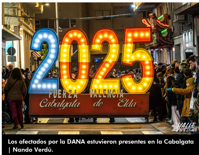
Los afectados por la DANA estuvieron presentes en la Cabalgata | Nando Verdú.

Antes de la llegada de Sus Majestades de Oriente llegó la representación del Nacimiento, así como una gran estrella de Navidad que, al igual que hacen los antorcheros hoy en día, en su momento guio a Melchor, Gaspar y Baltasar a Belén.