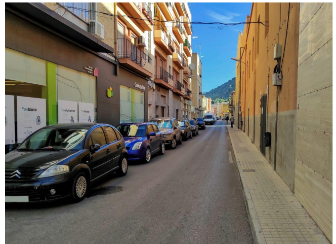
En esta calle se instaló el primer supermercado de Petrer "El Super"