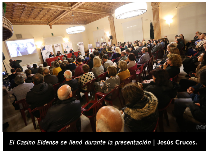
El Casino Eldense se llenó durante la presentación | Jesús Cruces.

Una mirada al pasado está a la venta en las librerías y quioscos de Elda y Petrer al precio de 30 euros.