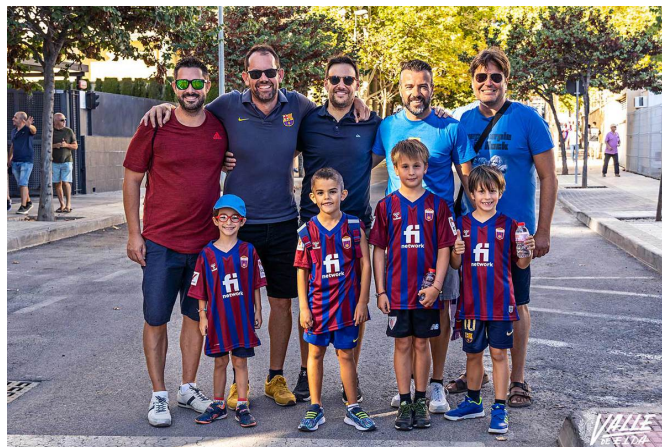
Adultos y menores disfrutaron del partido | Nando Verdú.

Y no solo los locales de la zona, sino que muchos bares y cafeterías de la ciudad emitieron el partido para que lo disfrutara la población que no asistió al estadio.