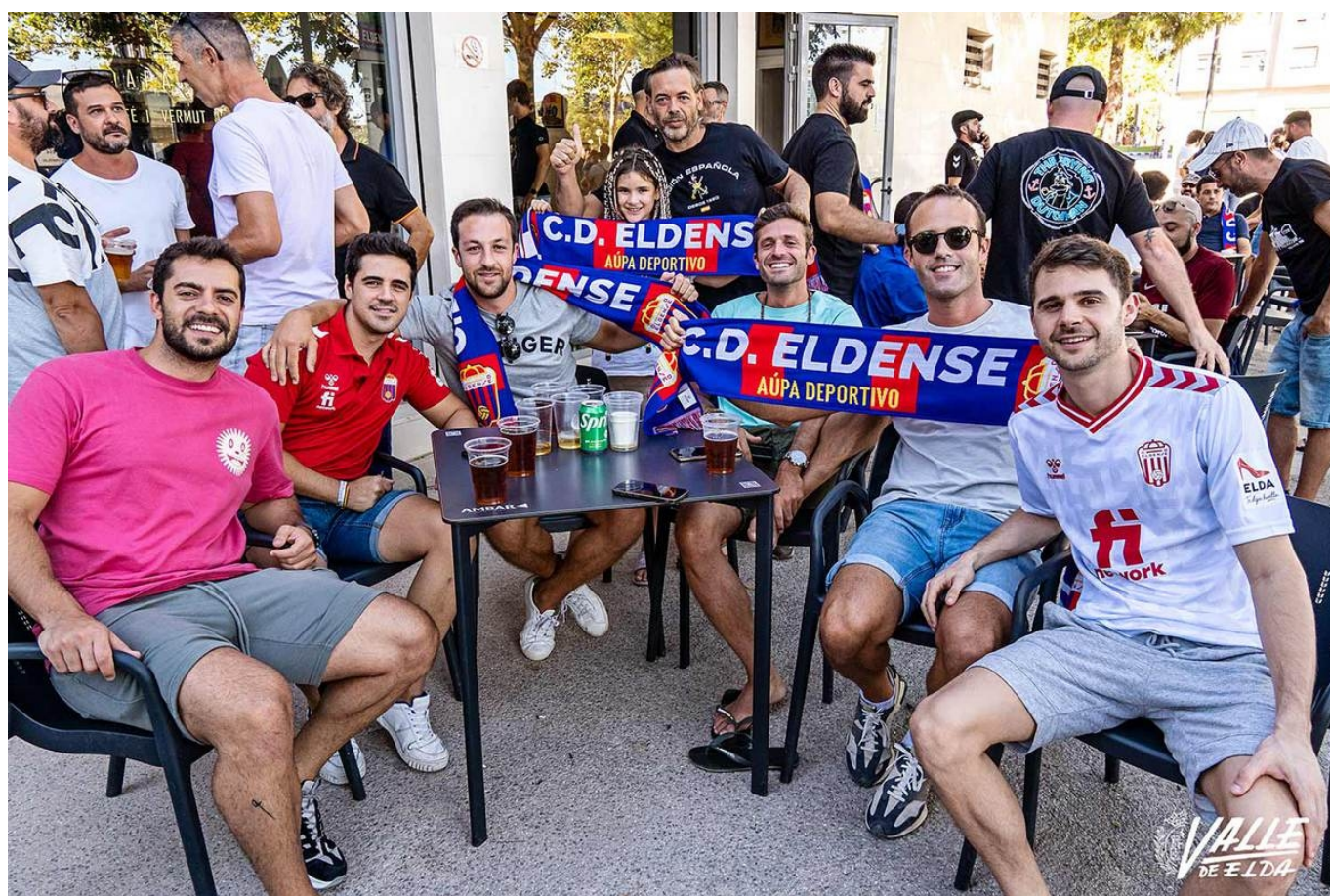
Los bares de la zona estaban abarrotados antes del partido | Nando Verdú.

Los alrededores del Nuevo Pepico Amat durante la tarde de ayer contaban con un gran ambiente gracias al primer partido de liga profesional de la temporada . Al Nuevo Pepico Amat entraron 4.356 espectadores para presenciar el partido entre el Eldense y el Eibar , pero fueron muchas más las personas que acudieron a la zona para disfrutar de este momento y empaparse del ambiente de alegría y deporte que se respiraba.