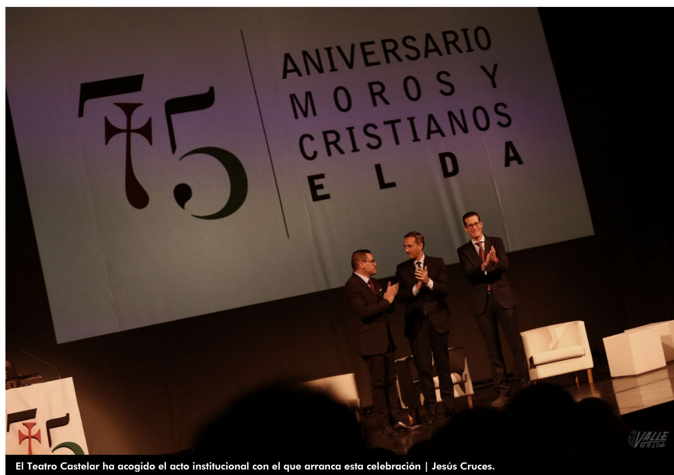
El Teatro Castelar ha acogido el acto institucional con el que arranca esta celebración

Las fiestas de Moros y Cristianos de Elda viven uno de sus momentos más dulces en 2019 , año de su 75º aniversario . Estas fiestas cuentan con 8.000 festeros inscritos y se calcula que más de 11.000 las personas participan en la fiesta en los cinco días en los que Elda se detiene para vivir de lleno esta celebración, además de los 20.000 espectadores que disfrutan de los triunfales desfiles . La Junta Central de Moros y Cristianos ha iniciado esta tarde de forma oficial la celebración del 75º aniversario con la gala institucional de apertura en un completo Teatro Castelar. Así arranca un intenso año festivo en el que casi