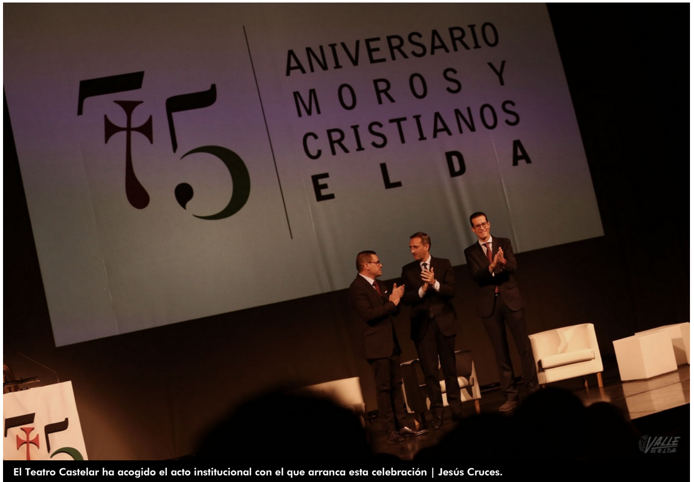
El Teatro Castelar ha acogido el acto institucional con el que arranca esta celebración | Jesús Cruces.

Las fiestas de Moros y Cristianos de Elda viven uno de sus momentos más dulces en 2019 , año de su 75º aniversario . Estas fiestas cuentan con 8.000 festeros inscritos y se calcula que más de 11.000 las personas participan en la fiesta en los cinco días en los que Elda se detiene para vivir de lleno esta celebración, además de los 20.000 espectadores que disfrutan de los triunfales desfiles . La Junta Central de Moros y Cristianos ha iniciado esta tarde de forma oficial la celebración del 75º aniversario con la gala institucional de apertura en un completo Teatro Castelar. Así arranca un intenso año festivo en el que casi