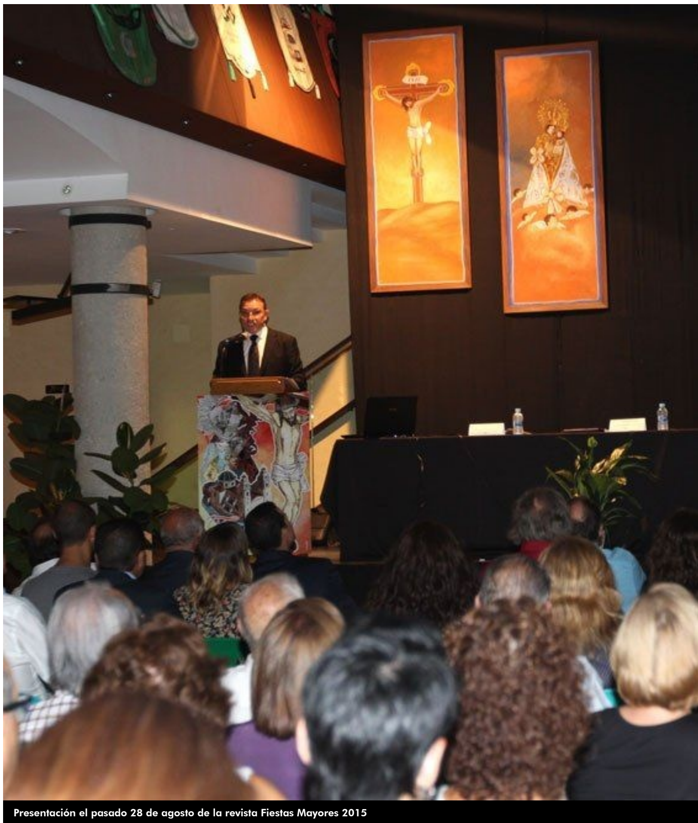
Presentación el pasado 28 de agosto de la revista Fiestas Mayores 2015

Comienza un nuevo curso y con él otra temporada en este y el resto de blogs de Valle de Elda. Seguro que han aprovechado las vacaciones para engullir todos esos libros que durante el resto del año, por tantos y tan diversos motivos, no pudieron leer. En la playa o en el campo, al amanecer o al atardecer, solos o acompañados, leer siempre estimula nuestra imaginación y todos nuestros sentidos. Igual que conversar con esos