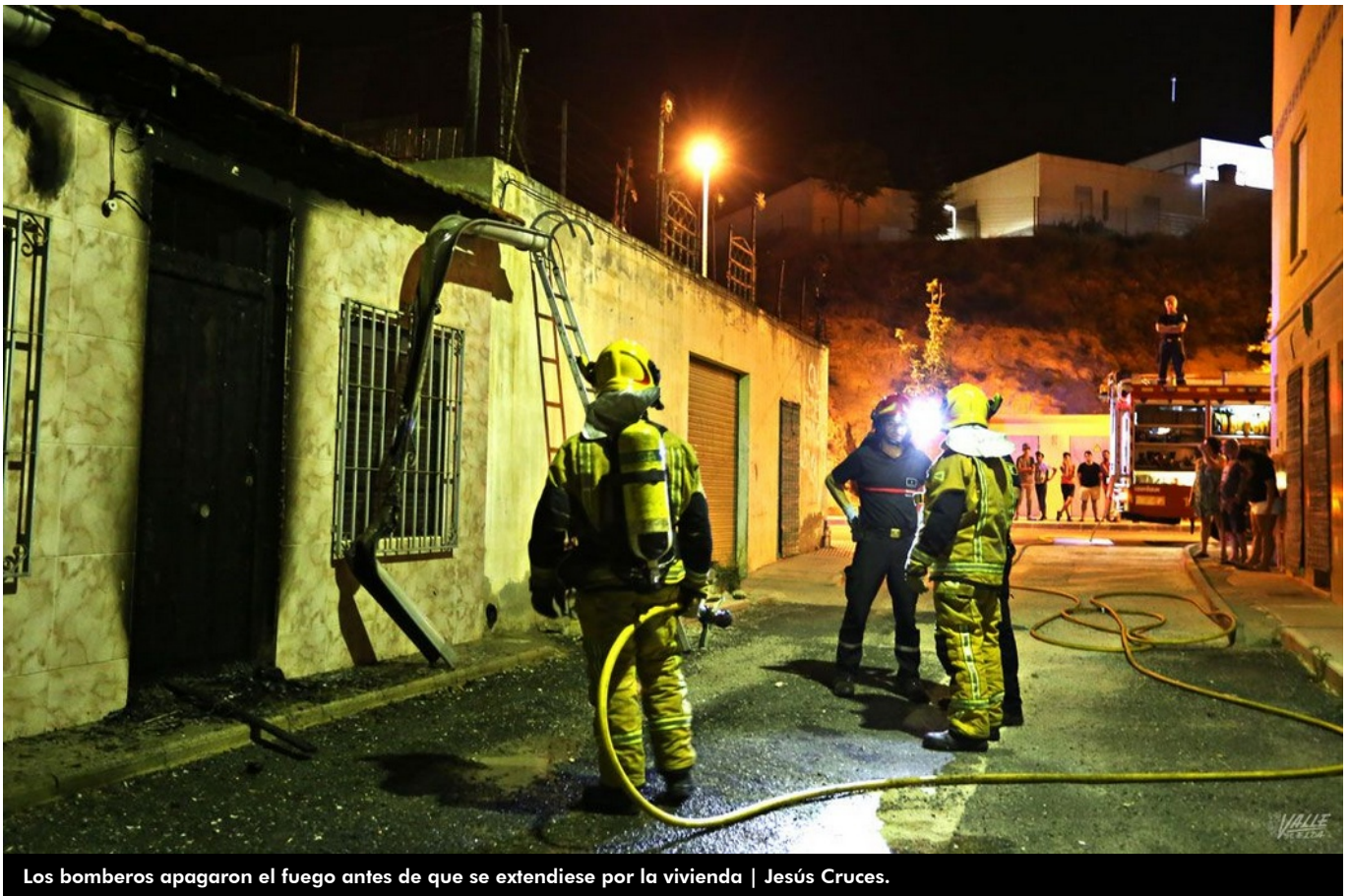
Los bomberos apagaron el fuego antes de que se extendiese por la vivienda

Las alarmas volvieron a saltar anoche en la calle Federico García Lorca de Elda pasadas las 22:30 horas debido al incendio en la fachada de la vivienda del presunto homicida, un anciano de 70 años de edad, que ayer habría acabado con la vida de su vecino tras una fuerte discusión . El fuego, al parecer intencionado , comenzó en la persiana de la puerta y no afectó al interior del inmueble.