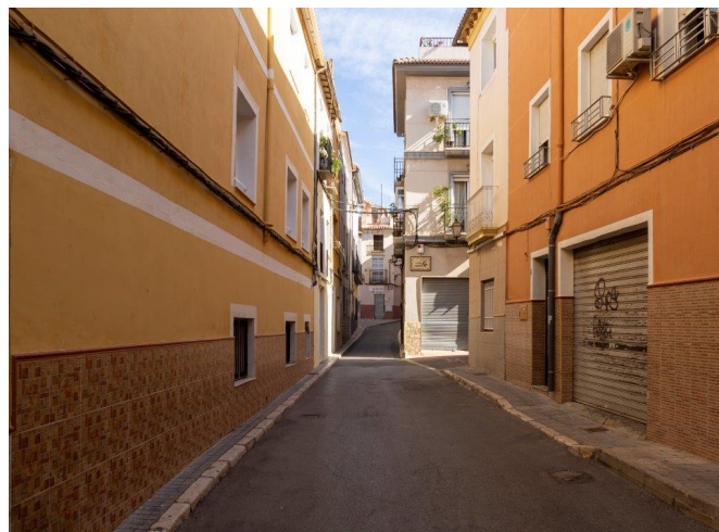
Cruce de la calle Gabriel Brotons con la calle Castelar

En la sesión plenaria del 31 de mayo de 1979, tras la entrada de los ayuntamientos democráticos, el grupo municipal comunista consideró necesario hacer desaparecer los nombres de todas las calles, plazas y avenidas que recordasen la Guerra Civil, proponiendo cambiar su nombre por el de Juan Ramón Jiménez. Sin embargo, esta propuesta no fue aprobada.