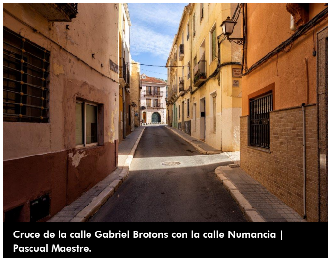
Cruce de la calle Gabriel Brotons con la calle Numancia

El 24 de agosto de 1881, festividad de San Bartolomé Apóstol, fue inaugurada y bendecida la fuente de San Bartolomé o de los cuatro chorros según reza la documentación de la época, en la que conocemos