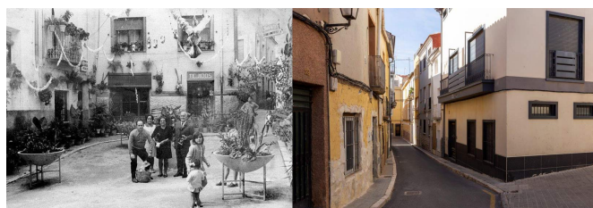
La conocida como placeta de Vera forma parte de esta vía urbana. En esta placeta estaba la fuente de los cuatro chorros.