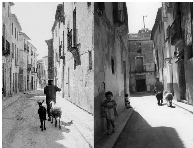
Dos imágenes de la calle Gabriel Brotons que nos hablan de un Petrer agrícola y nos transportan a un pueblo muy distinto al actual