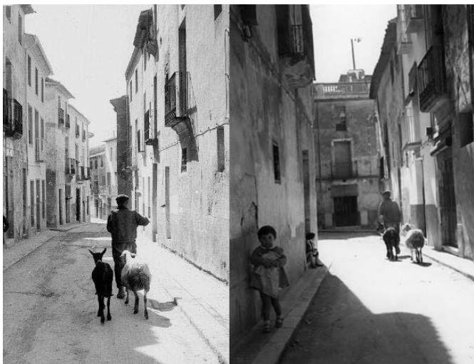
Dos imágenes de la calle Gabriel Brotons que nos hablan de un Petrer agrícola y nos transportan a un pueblo muy distinto al actual