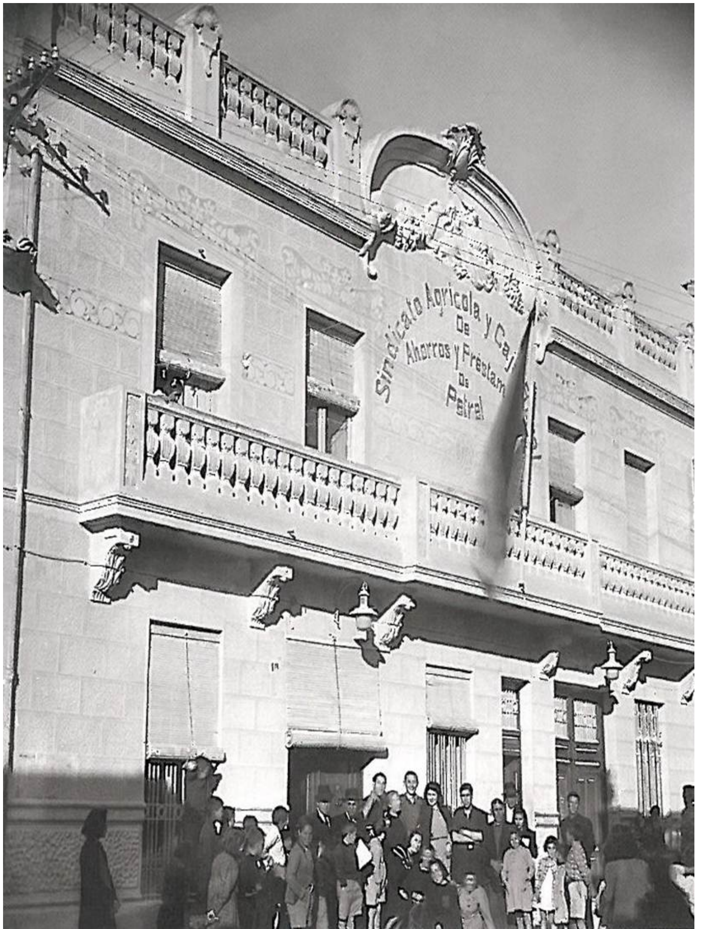
Edificio del Sindicato Agrícola y Caja Rural de Ahorros y Préstamos de Petrer en la calle Gabriel Payá. La Ley de Cooperación de 1942 provocó el cambio de Sindicato por el de Cooperativa.