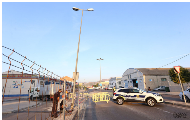
Un carril ha sido cortado al tráfico mientras se retiraba la farola.