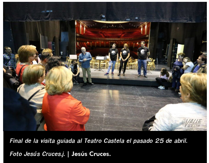
Final de la visita guiada al Teatro Castela el pasado 25 de abril.

Quiero alabar la gestión privada, durante muchos años en España, de empresarios y dueños de teatros que han contribuido al crecimiento cultural de nuestra sociedad . Actualmente existen ya muy pocos teatros de titularidad privada, apenas unos pocos en grandes ciudades y alguna capital de provincia. La mayoría de los teatros, en un proceso que comenzó en los años ochenta del siglo pasado, han acabado siendo de titularidad pública.