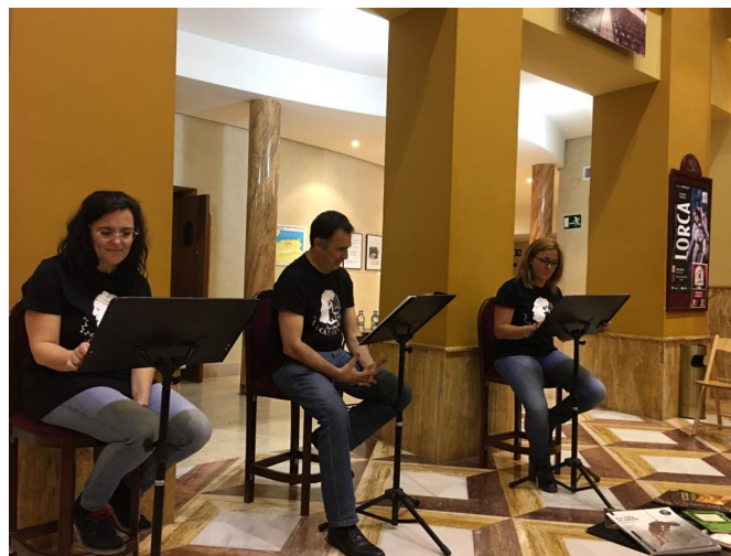
Lectura dramatizada del texto de Jardiel Poncela por el grupo El mundo de Calíope .