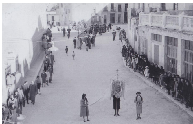
Procesión de la Purísima a su paso por la calle José Perseguer. Medios de los años 50.

bajos y las partes traseras de estas casas que eran postigos, corrales y almacenes con el tiempo se convirtieron en una zona de expansión del pueblo y dotaron de una intensa actividad comercial y social a la calle José Perseguer. En la confluencia entre Gabriel Payá y José Perseguer, alrededor de los años 30 del siglo XX, había una fuente con un grifo y un abrevadero, l'abeuraor , delante del corral que más tarde sería la carnicería del Roig y este lugar se conocía como el Portal. No sabemos el origen de este topónimo, pero casi con toda seguridad hace referencia al portón grande que había en este lugar y que servía para entrar los carros o quizás portal como la puerta del pueblo en sentido figurado, ya que en los años 20 y 30 del pasado siglo la calle Gabriel Payá era la entrada al pueblo.