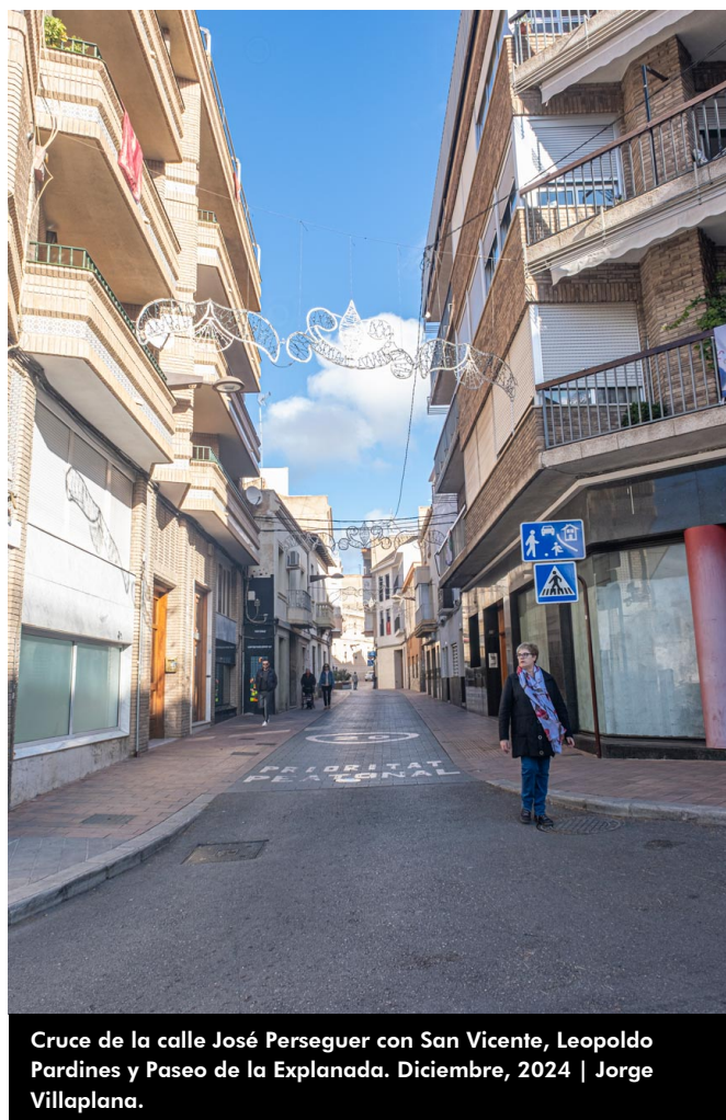
Cruce de la calle José Perseguer con San Vicente, Leopoldo Pardines y Paseo de la Explanada. Diciembre, 2024