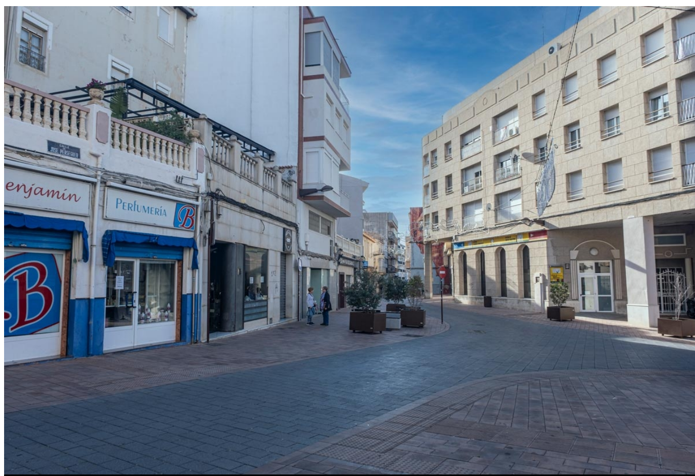
Calle José Perseguer. Diciembre, 2024 | Jorge Villaplana.

Iniciamos con este artículo una serie de trabajos que recorrerá la calle José Perseguer, un lugar lleno de vida y comenzaremos con esta primera entrega conociendo los nombres que ha tenido esta vía urbana a lo largo de la historia.