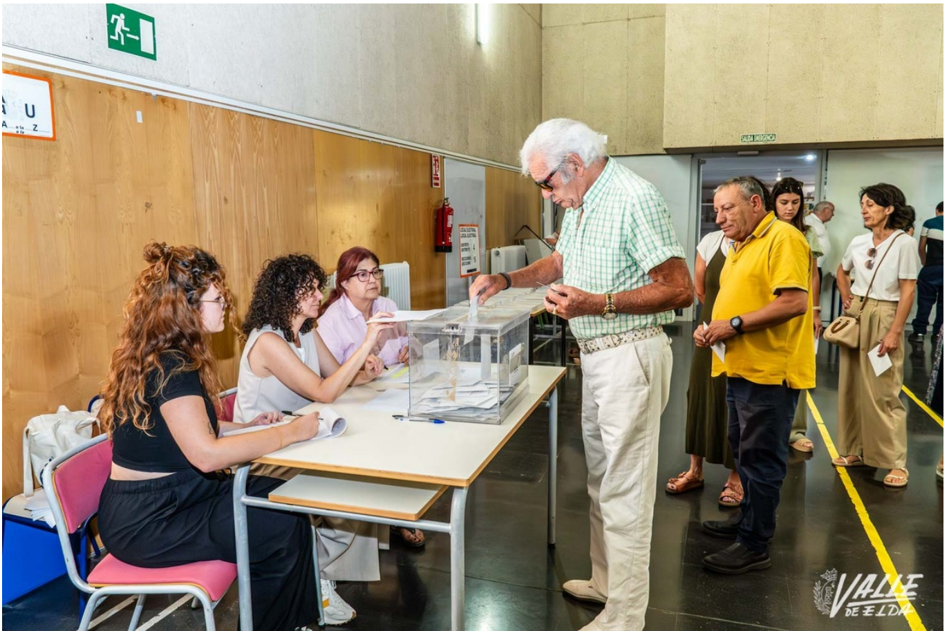
El 50% de la población ejerció su derecho al voto | Nando Verdú.

El Partido Popular obtuvo ayer unos resultados muy positivos en las elecciones al Parlamento Europeo, pues se han vuelto a posicionar como primera fuerza en el valle. Tanto en Elda como en Petrer crece el apoyo en más de 2.000 votos respecto a los comicios europeos de 2019. Pasa a ser así la primera fuerza política a nivel europeo. La sorpresa la ha dado la agrupación de lectores Se acabó la fiesta , que pasa a ser la cuarta fuerza política en ambas localidades. El PSOE y Vox son la segunda y tercera, respectivamente.