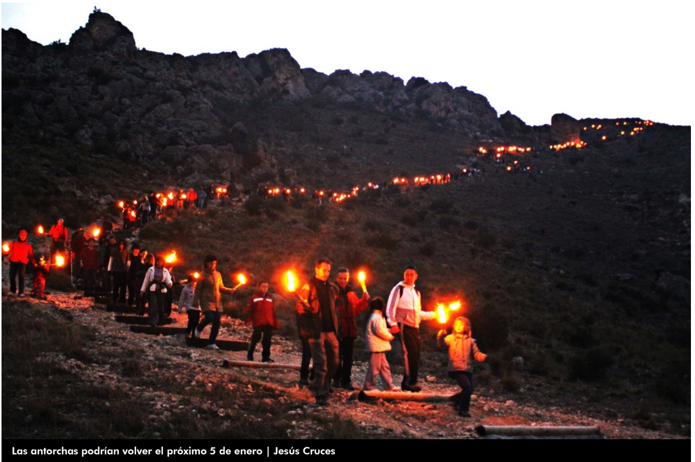
Las antorchas podrían volver el próximo 5 de enero | Jesús Cruces

Los eldenses podrían volver a subir con antorchas a Bolón el próximo 5 de enero ya que el equipo de gobierno formado por el Partido Socialista y Compromís está estudiando la creación de una comisión para conseguir legalizar esta tradición que gusta a grandes y pequeños.