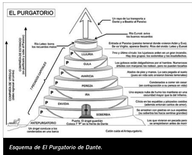
Esquema de El Purgatorio de Dante.

lugar de la alta fantasía donde se empapa la imaginación humana. Una imaginación que para el italiano se constituye como repertorio de lo potencial, de lo que no es pero que hubiera podido ser. Y desde luego, llegados a este punto, cabe preguntarse si la ciencia, la literatura o el pensamiento podrían existir sin la capacidad imaginativa del hombre. Preservar esas nubes saturadas de lluvia de la fantasía sigue siendo imprescindible para garantizar el desarrollo de las potencialidades humanas.