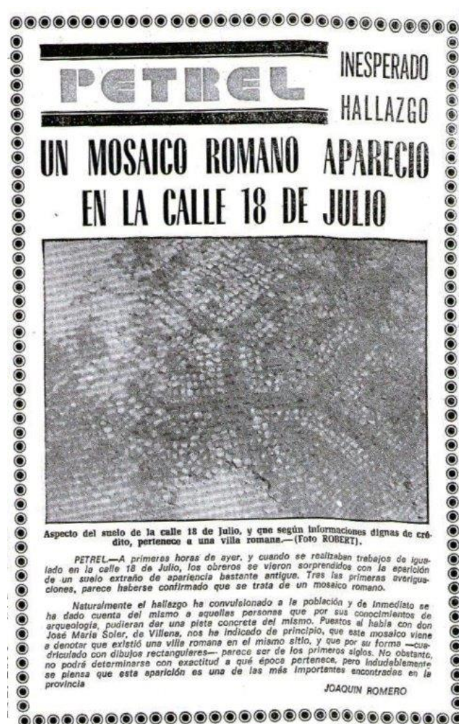
La noticia de la aparición del mosaico en el diario Información. 12-IX-1975.

estudio que se hizo entre el laboratorio de restauración del MARQ y el Museo Dámaso Navarro para la exposición Petrer. Arqueología y museo de 2018, se piensa que el mosaico estaría colocado en un patio circular de la parte de la residencia de los dueños de la villa.