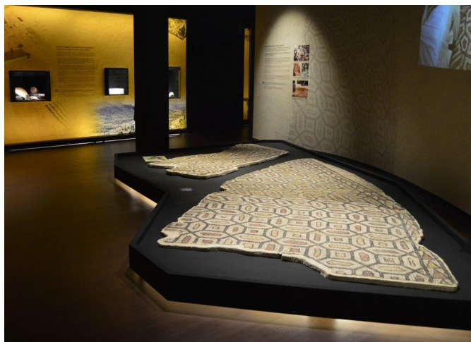
Exposición del mosaico en el nuevo y flamante Museo municipal Dámaso Navarro.

significación histórica, la pieza más importante que se conserva en el renovado Museo Dámaso Navarro.