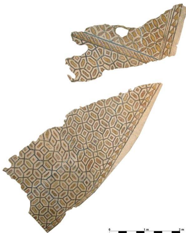
El mosaico, todo un lujo y un referente para la historia de Petrer.

mosaico acudiendo al Museo Arqueológico y Etnológico Municipal Dámaso Navarro , situado en la calle La Fuente. Es una visita que no os podéis perder.