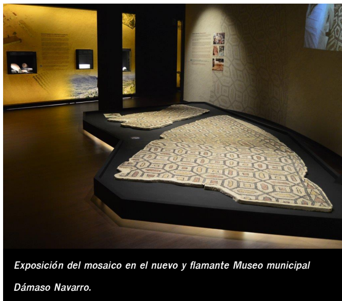
Exposición del mosaico en el nuevo y flamante Museo municipal Dámaso Navarro.

significación histórica, la pieza más importante que se conserva en el renovado Museo Dámaso Navarro.