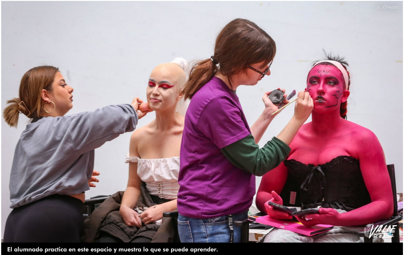
El alumnado practica en este espacio y muestra lo que se puede aprender.

El Baúl del Estudio y del Empleo ha arrancado hoy en el Centro Cívico y la Plaza de la Ficia con éxito. Más de medio centenar de centros educativos no solo de Elda sino de la provincia participan en este evento con la única intención de que los jóvenes conozcan las oportunidades laborales y profesionales de cara a su futuro.