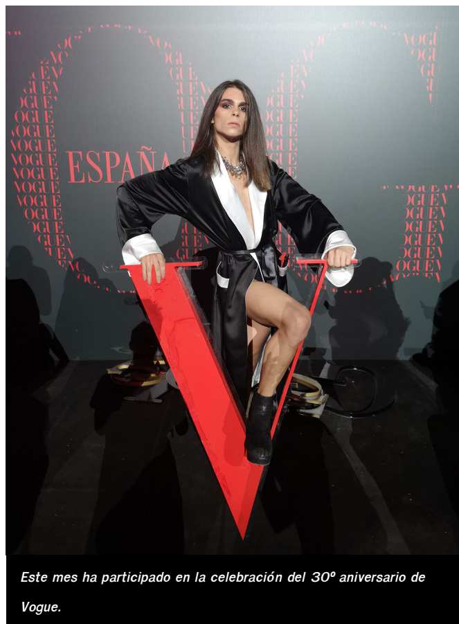
Este mes ha participado en la celebración del 30º aniversario de Vogue.