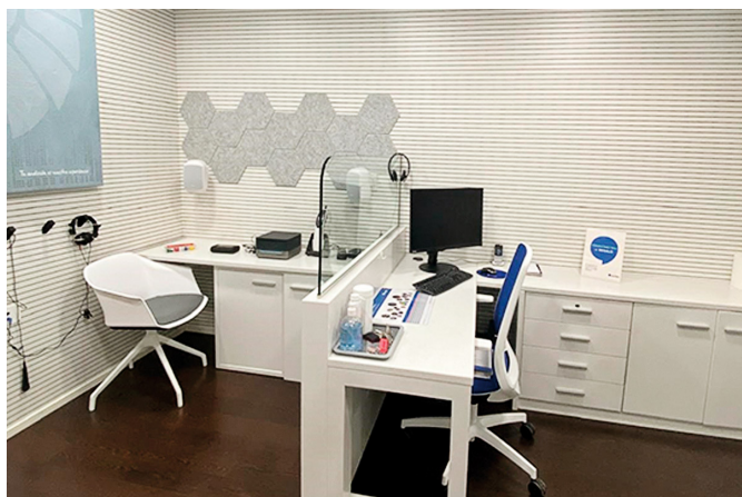
Cuentan con la última tecnología.

Por ello, la apuesta por la detección y prevención de la pérdida auditiva es una de las máximas en Audika. Acompañan al paciente a lo largo de todo el proceso para que pueda alcanzar su máximo potencial auditivo y minimizar el impacto emocional que la pérdida auditiva pueda generar.