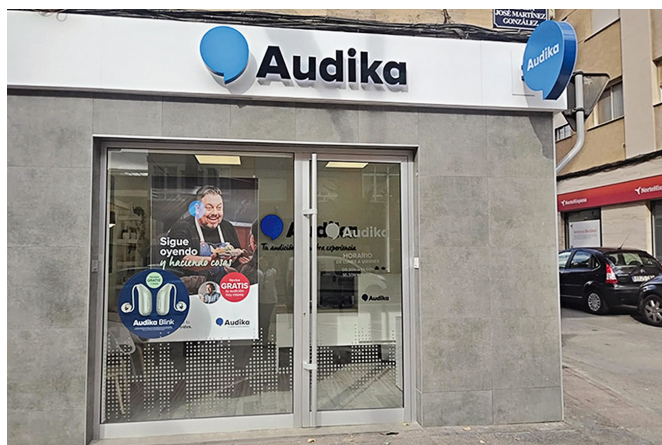
Están en la avenida José Martínez González, número 103, y en la calle Pablo Iglesias, número 43.

Cuidar de tu audición y tratar los problemas a tiempo mejorará tu calidad de vida.