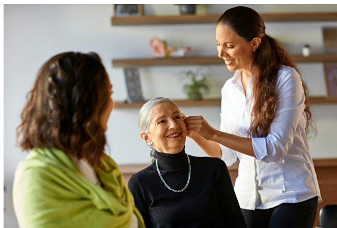
Cuidan de cada paciente.

Actualmente, las soluciones auditivas son muy variadas y se ajustan a las necesidades de cada persona. Una de las mejores soluciones son los audífonos. Los audífonos Audika son discretos e innovadores. Su tecnología está diseñada para imitar la forma en como el cerebro procesa el sonido. Además, se pueden conectar a tus dispositivos electrónicos para ofrecer una mejor experiencia sonora, lo que permite al usuario conectar de nuevo con su entorno sin que se pierda ningún detalle.