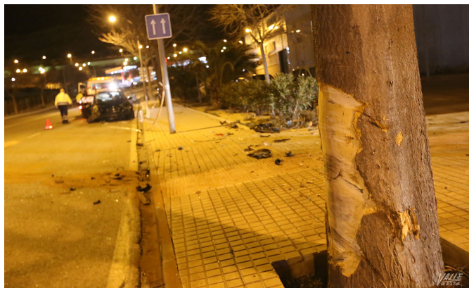
Imagen del árbol contra el que impactó el coche | Jesús Cruces.