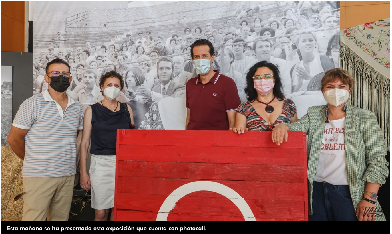
Esta mañana se ha presentado esta exposición que cuenta con photocall.

Valle de Elda tiene a punto la exposición que ha organizado junto al Ayuntamiento de Elda para conmemorar el 75 aniversario de la construcción de la Plaza de Toros , que muy pronto será rehabilitada. La muestra, que recoge la historia del coso y los eventos que acogió, no solo taurinos sino también culturales y deportivos , se inaugura esta tarde a las 20:30 horas en el Museo del Calzado y se podrá visitar hasta el 31 de julio.