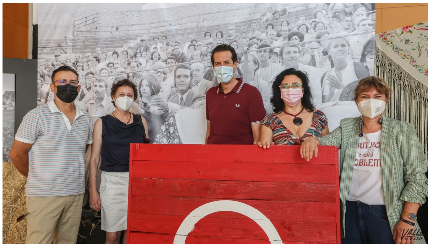
Esta mañana se ha presentado esta exposición que cuenta con photocall.

Valle de Elda tiene a punto la exposición que ha organizado junto al Ayuntamiento de Elda para conmemorar el 75 aniversario de la construcción de la Plaza de Toros , que muy pronto será rehabilitada. La muestra, que recoge la historia del coso y los eventos que acogió, no solo taurinos sino también culturales y deportivos , se inaugura esta tarde a las 20:30 horas en el Museo del Calzado y se podrá visitar hasta el 31 de julio.