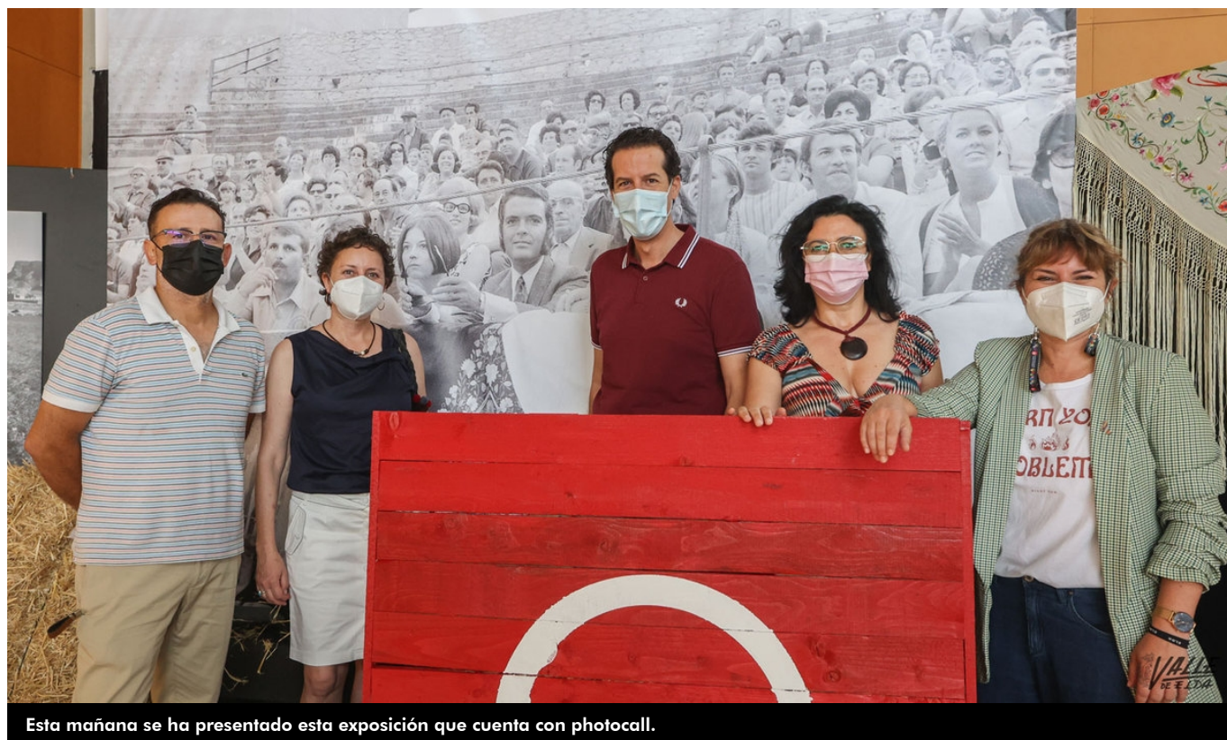
Esta mañana se ha presentado esta exposición que cuenta con photocall.

Valle de Elda tiene a punto la exposición que ha organizado junto al Ayuntamiento de Elda para conmemorar el 75 aniversario de la construcción de la Plaza de Toros , que muy pronto será rehabilitada. La muestra, que recoge la historia del coso y los eventos que acogió, no solo taurinos sino también culturales y deportivos , se inaugura esta tarde a las 20:30 horas en el Museo del Calzado y se podrá visitar hasta el 31 de julio.