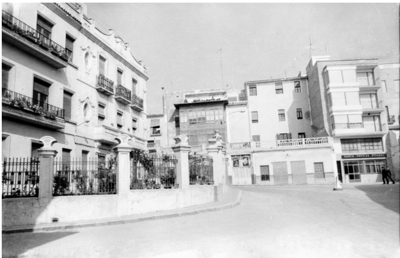
Al fondo los números impares de la calle José Perseguer.

Comenzamos el paseo por esta calle del corazón de Petrer y lo haremos con un recorrido detallado por la parte que corresponde a los números impares. Será un recorrido por los espacios y por el tiempo ya que, en algunas ocasiones, nos permitirá adentrarnos en comercios y pequeños negocios casi seculares. Nos detendremos y nos daremos cuenta de la vida que había detrás de cada uno de estos pequeños negocios que se convirtieron en proyectos vitales para hombres y mujeres que pusieron su ilusión, buen hacer y pasión en los mismos. Conoceremos tiendas que ya forman parte de la historia de Petrer y a personas que permanecieron muchos años detrás de un mostrador. Nos remontaremos