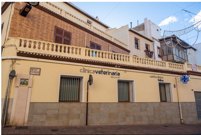
En el inicio de la calle está la Clínica Veterinaria Derrocat