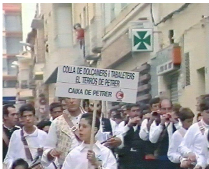
La trobada va tindre lloc els dies 27 i 28 d'octubre de 1990, fa ara 30 anys, i van assistir més de 500 músics.

La dolçaina i el tabalet són dos instruments populars valencians, els quals van molt lligats a totes les celebracions populars i festives. La Colla de Dolçainers i Tabaleters "El Terròs" de Petrer va reunir en Petrer eixos dos dies a dolçainers i tabaleters vinguts de totes les comarques valencianes i d'altres llocs del territori nacional i de fora de les nostres fronteres. Amb esta trobada, a banda de fer un entranyable i magnífic acte festiu, es pretenia intentar normalitzar la dolçaina i el tabalet.