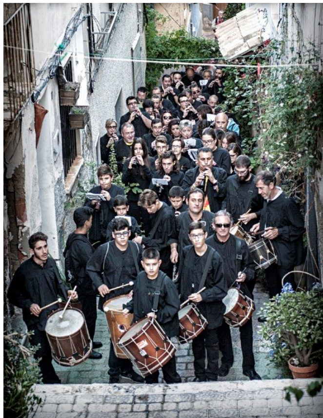
La Colla "El Terròs" 40 anys caminant al so. | Juan Pedro Verdú Rico.

L'Aplec va començar el dissabte 27, al migdia donant la benvinguda als 70 grups participants en la plaça de Baix. Però sense dubtes l'acte més espectacular va ser l'entrada d'eixos grups i la interpretació tots junts de la "Tocata de Villagordo" en la plaça que va ser impressionant i sobrecollidora. Esta concentració de dolçainers, hui, encara és recordada com una fita important per tot el món dolçainer i, nosaltres, a través d'esta crònica, hem volgut portar-la a la memòria. Coneixem de primera mà la il·lusió i l'esforç que van posar tots els que van fer possibles estos dos dies històrics per a Petrer que es va omplir de música, de festa i de tradició. Sense lloc a dubtes, este Aplec va ser l'esdeveniment musical més important de tots els que havien tingut lloc a Petrer en tota la seua història. I, com sempre, la resposta de tot el poble va ser fonamental i va saber emparar, com sols ell sap fer-ho, els músics vinguts de tot arreu.