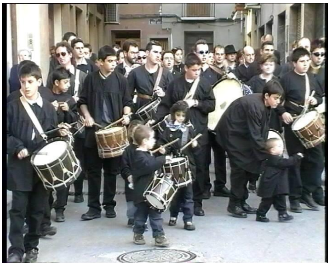
La Colla passeja el nom de Petrer per tot arreu.

L'Aplec va començar el dissabte 27, al migdia donant la benvinguda als 70 grups participants en la plaça de Baix. Però sense dubtes l'acte més espectacular va ser l'entrada d'eixos grups i la interpretació tots junts de la "Tocata de Villagordo" en la plaça que va ser impressionant i sobrecollidora. Esta concentració de dolçainers, hui, encara és recordada com una fita important per tot el món dolçainer i, nosaltres, a través d'esta crònica, hem volgut portar-la a la memòria. Coneixem de primera mà la il·lusió i l'esforç que van posar tots els que van fer possibles estos dos dies històrics per a Petrer que es va omplir de música, de festa i de tradició. Sense lloc a dubtes, este Aplec va ser l'esdeveniment musical més important de tots els que havien tingut lloc a Petrer en tota la seua història. I, com sempre, la resposta de tot el poble va ser fonamental i va saber emparar, com sols ell sap fer-ho, els músics vinguts de tot arreu.