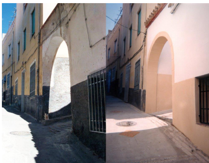
El arco antes y después de la restauración.

Los arcos eran puertas de entrada de barrios y calles, existiendo desde el urbanismo musulmán . La calle, y por tanto el nombre, Arco del Castillo, está atestiguada al menos desde 1853, aunque de nuevo nos encontramos con escasez documental y arqueológica referente a los periodos anteriores en esta zona del centro histórico. Lo que sí es cierto es que el arco no corresponde a la puerta de una antigua muralla musulmana , como se suponía hace tiempo. No obstante, la distribución actual de vías estrechas y tortuosas con pequeñas placetas nos apuntan a un urbanismo que sigue las curvas de nivel del cerro rematado por la fortaleza. Las evidencias arqueológicas más importantes del poblamiento islámico las encontramos en las excavaciones efectuadas en la explanada del castillo a finales de la década de los ochenta del siglo XX, y esporádicamente en distintos puntos como en la calle Faldas del Castillo, calle Mayor, plaza de Baix, calle San Antonio o calle Nueva.