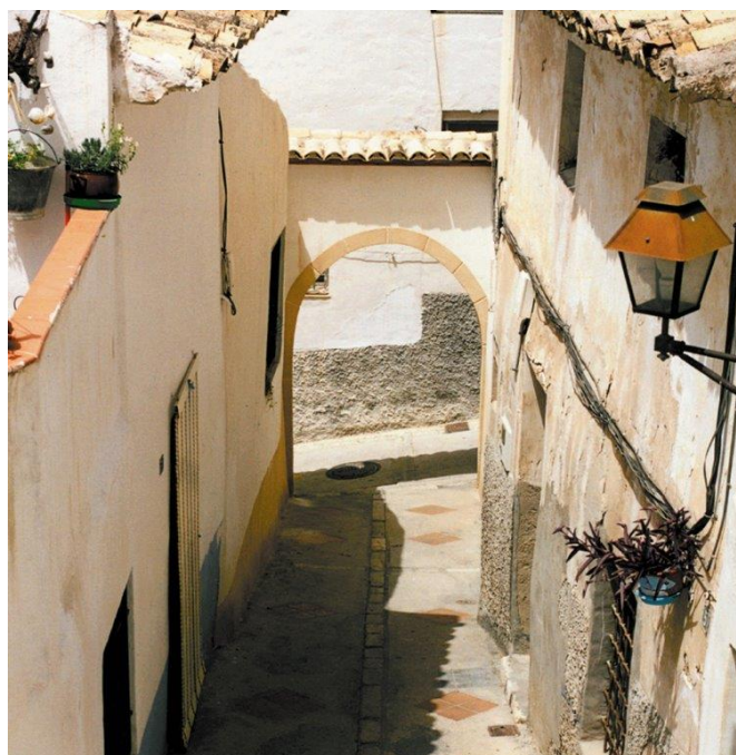
Esta calle conecta la calle Castillo con la de Faldas del Castillo.