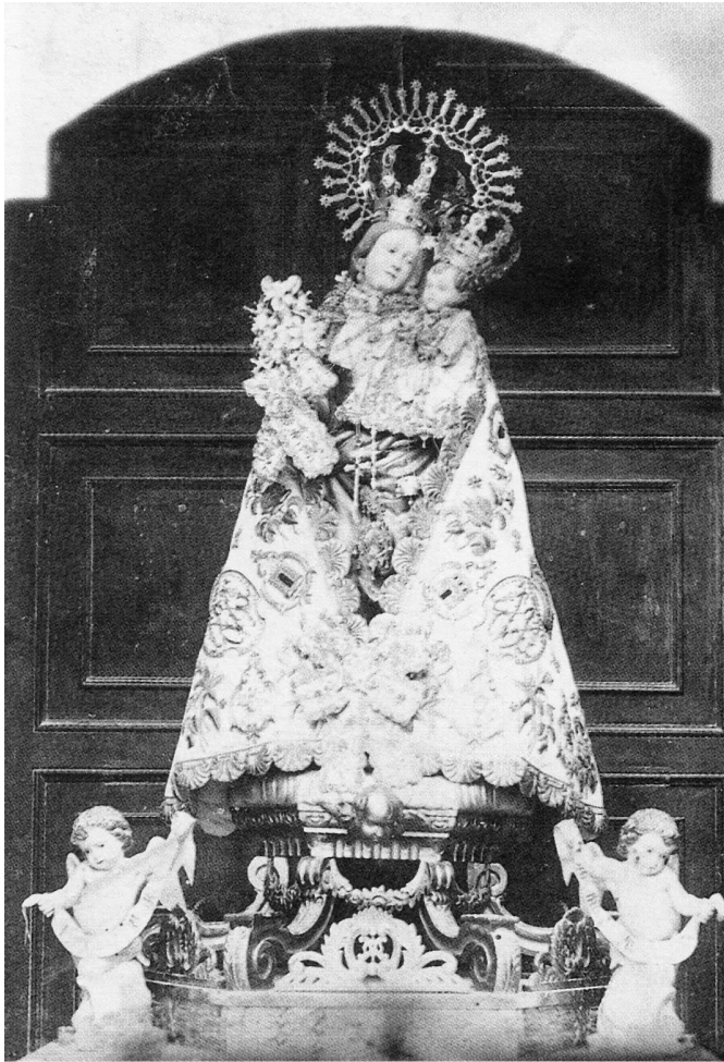
Talla de la Virgen de la Salud, quemada en 1936.