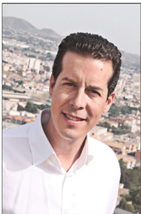
Rubén Alfaro Alcalde de Elda