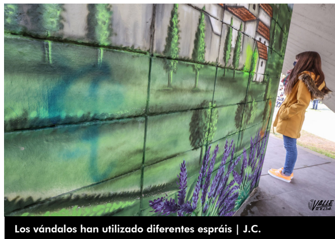
Los vándalos han utilizado diferentes espráis

Elda y del valle y que datan de 1858. Recoge el Castillo, la antigua iglesia de Santa Ana, el Cid, Bolón, el desaparecido Convento, así como la Elda más rural y agrícola. El diseño también cuenta con el busto del propio Castelar y la frase “Guardo grabada en mi memoria las calles enarenadas de salvia y espliego entre nubes de incienso y dulces melodías” de su texto Recuerdos de Elda o Las fiestas de mi pueblo.