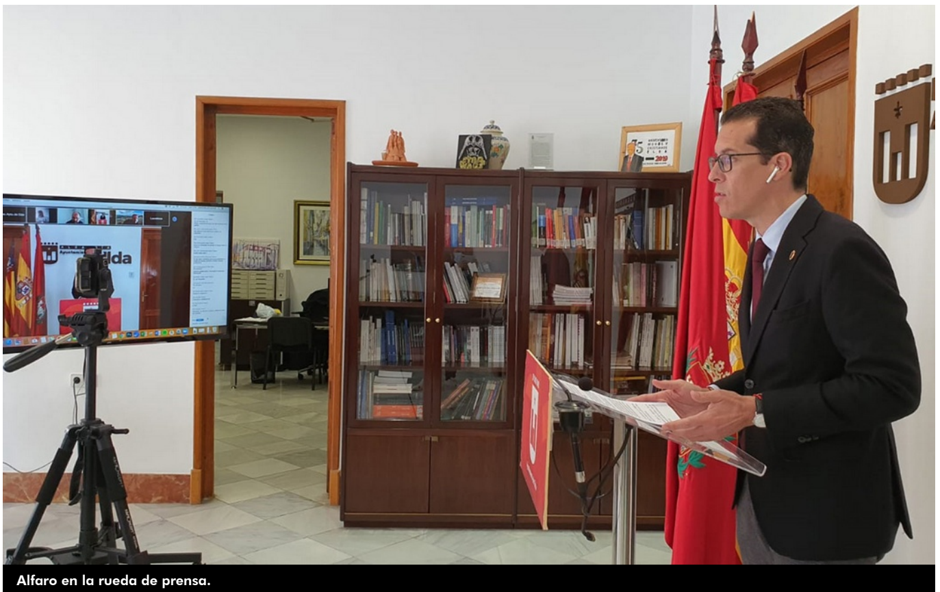
Alfaro en la rueda de prensa.

El alcalde de Elda, Rubén Alfaro , ha dado una rueda de prensa virtual para anunciar un paquete de medidas sociales y económicas de 2,2 millones de euros para “ proteger a los eldenses, para que nadie se quede atrás en esta crisis sanitaria y económica ”, ha afirmado. La máxima autoridad local ha señalado que “esta es una medida para impulsar la economía de las empresas y autónomos”. También ha asegurado que conoce la incertidumbre de la población eldense y por ello buscan ofrecer estas ayudas.