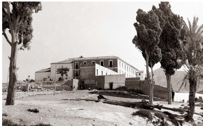
Vista del Manicomio Provincial de Alicante (1892-1942), instalado en el antiguo convento franciscano de Elda.

como cuartel de la Milicia Nacional de Elda (1836-1841), como Hospital Provincial de distrito (1862-1892) y como Manicomio Provincial de Alicante (1892-1942). Sin embargo su origen permanece todavía en la oscuridad del Saber, lleno de incógnitas sobre las que solo la futura investigación documental y los trabajos arqueológicos en curso permitirán arrojar luz.