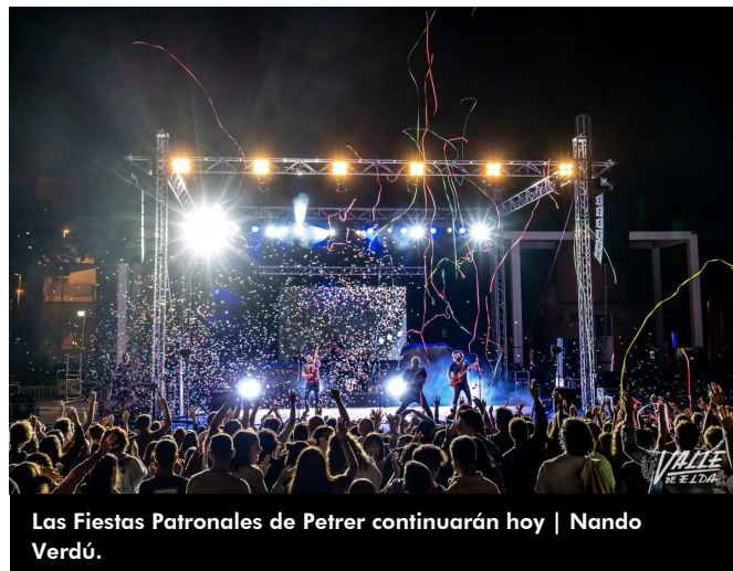
Las Fiestas Patronales de Petrer continuarán hoy

momento que todos los presentes encendieron la linterna de su móvil a la vez que cantaban con el grupo.