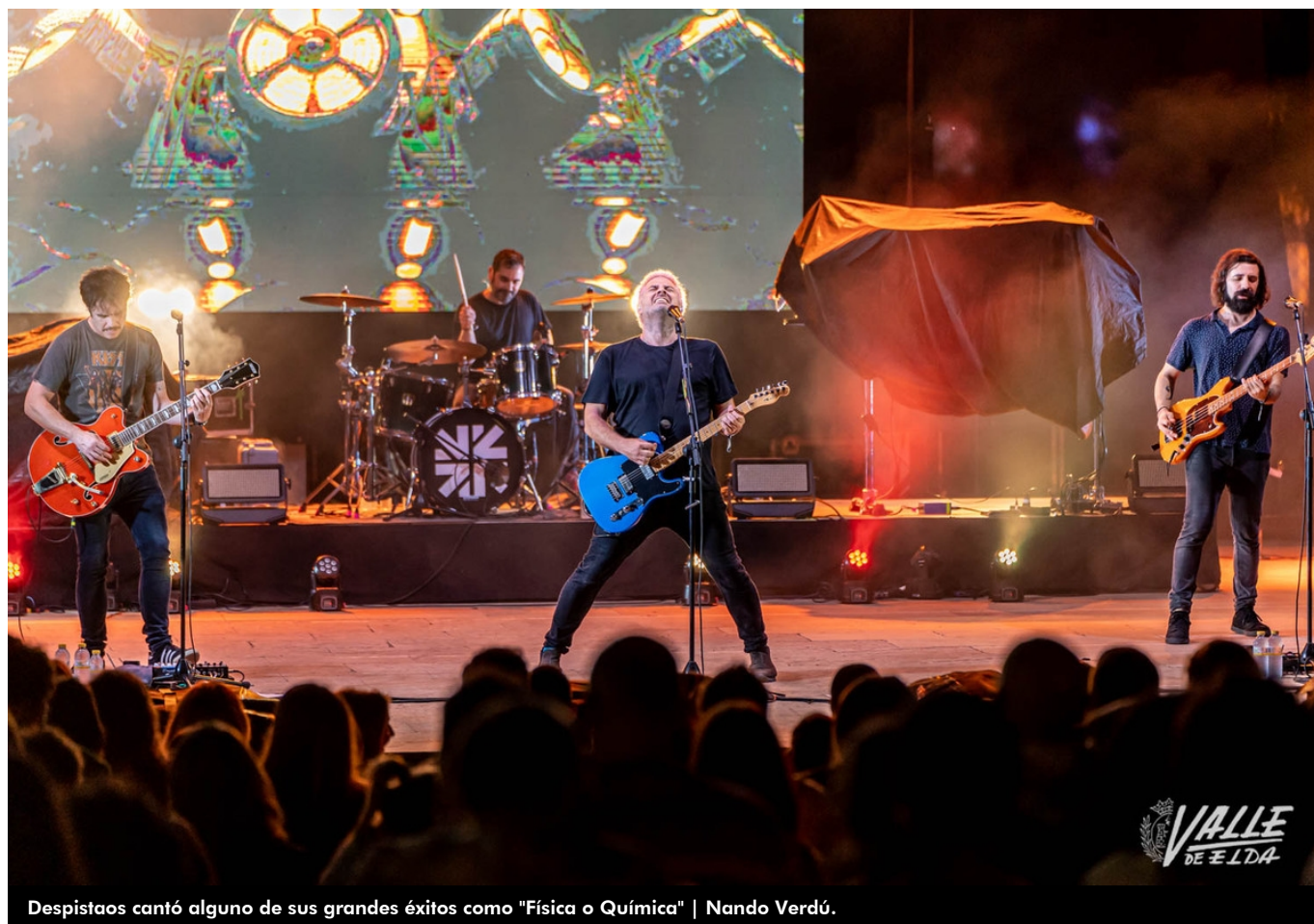
Despistaos cantó alguno de sus grandes éxitos como "Física o Química" | Nando Verdú.

El día grande de la Virgen del Remedio ayer sábado dejó diferentes eventos para todos los gustos con pasacalles, Nanos i Gegants, la procesión. Uno de los platos fuertes fue la actuación de Despistaos y La Fúmiga en el parque 9 d'Octubre. Miles de personas acudieron al céntrico jardín desde las 23 horas para disfrutar de una noche de música y amigos en la que el buen tiempo acompañó.