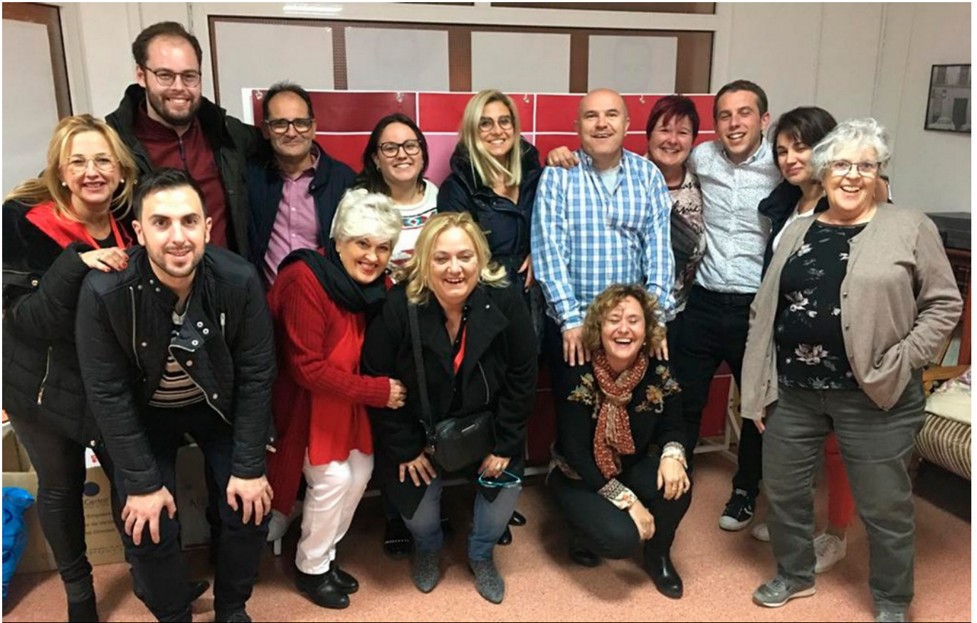
El PSOE se ha mostrado satisfecho con el resultado.

El PSOE ha vuelto a ser el partido más votado en Petrer en las elecciones generales al Congreso que se celebraron ayer al contar con un 30,58% de los votos . Aunque ha perdido apoyos por la bajada de la participación, mantiene un porcentaje similar a los resultados del pasado mes de abril. Le siguen el PP con el 20,3% , Vox con el 17,5% , Unidas Podemos con el 15,83% y Ciudadanos con un 9,19% de los votos. La participación ha caído del 78,8% al 72,8%.