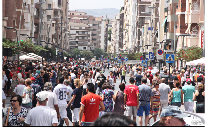
La abarrotada Gran Avenida esperando el paso de los ciclistas en 2011 | Jesús Cruces.

Hacia siete años que esta prestigiosa prueba pasó por Elda y Petrer, concretamente fue el 22 de agosto de 2011 .