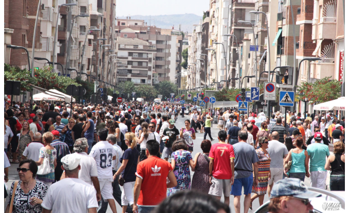
La abarrotada Gran Avenida esperando el paso de los ciclistas en 2011 | Jesús Cruces.

Hacia siete años que esta prestigiosa prueba pasó por Elda y Petrer , concretamente fue el 22 de agosto de 2011 .