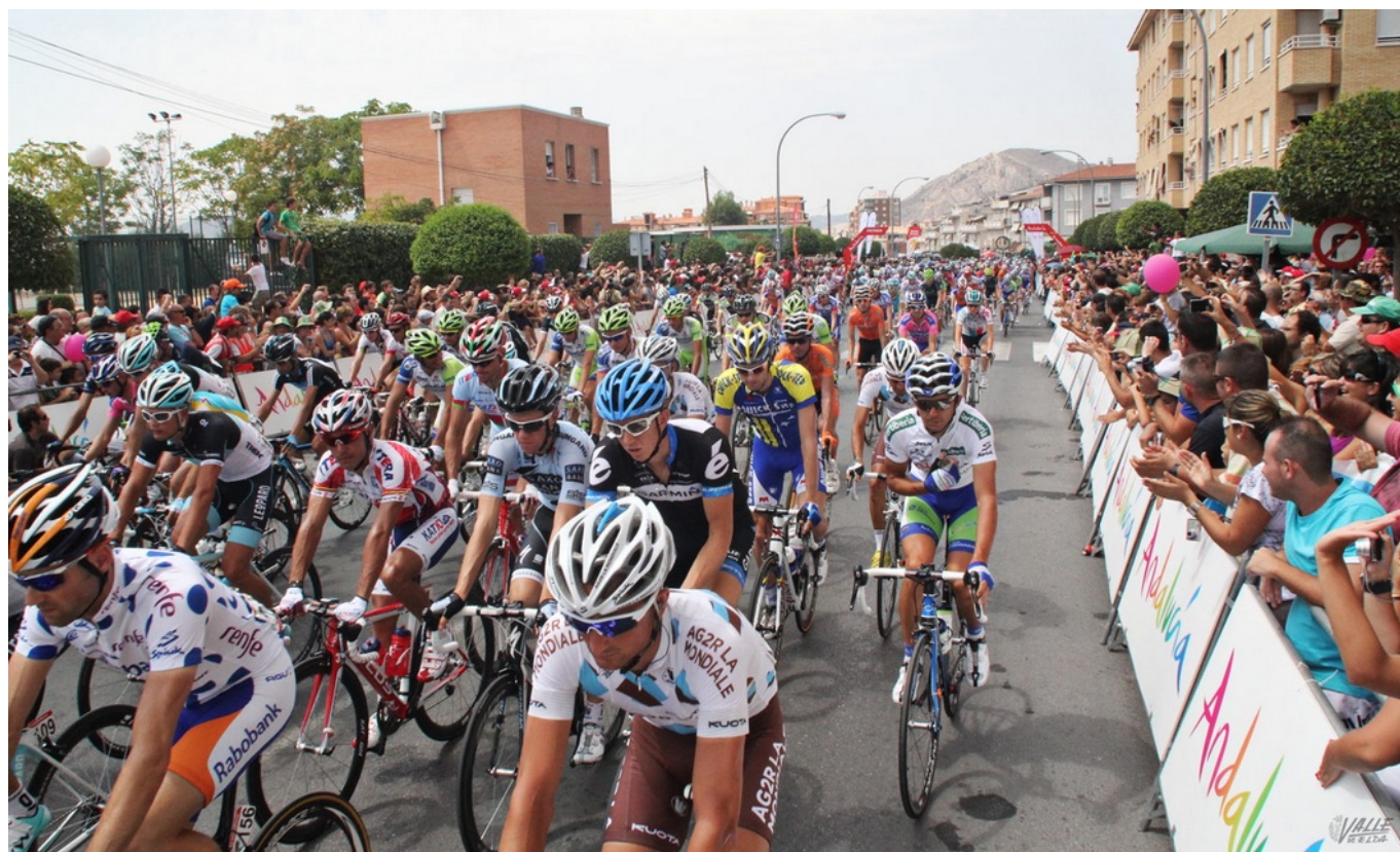
Imagen de la Vuelta Ciclista a España a su paso por Petrer en 2011

La Vuelta Ciclista a España en su 74ª edición volverá a pasar por los cascos urbanos de Elda y Petrer. Así se anunció ayer en el Auditorio de la Diputación de Alicante, donde se celebró la presentación del recorrido oficial de la competición . El presidente de la institución provincial, César Sánchez , presidió este acto en el que se dieron cita cerca de 1.500 personas para conocer todos los detalles de las 21 etapas que compondrán el trazado de esta competición internacional. Las tres de sus primeras etapas se desarrollarán en la provincia de Alicante.