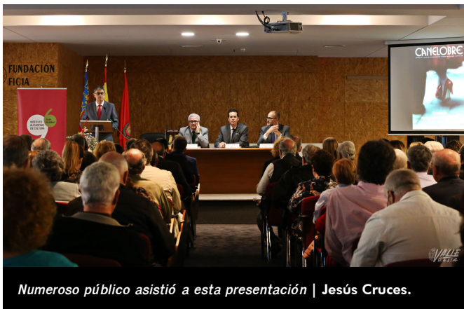
Numeroso público asistió a esta presentación