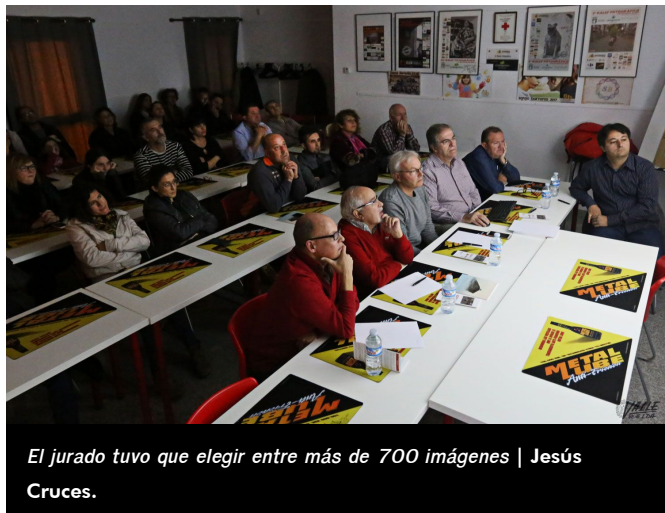
El jurado tuvo que elegir entre más de 700 imágenes