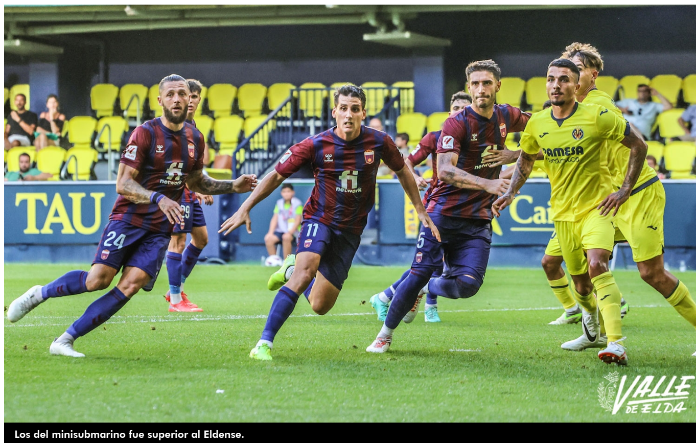
Los del minisubmarino fue superior al Eldense.