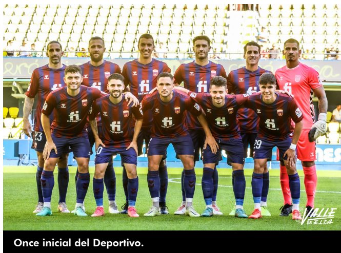
Once inicial del Deportivo.