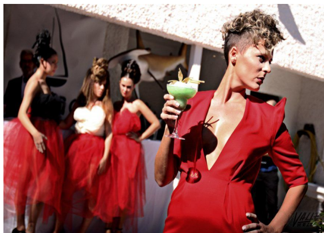
Los 19 modelos posaron en diferentes escenarios | Jesús Cruces.

En "The Opulence" se consiguió reflejar las nuevas tendencias a la perfección gracias a la colaboración de diferentes empresas que colaboraron con sus productos. Los peluqueros logran unos peinados que sorprenden gracias a los productos de alta calidad de Cotril.