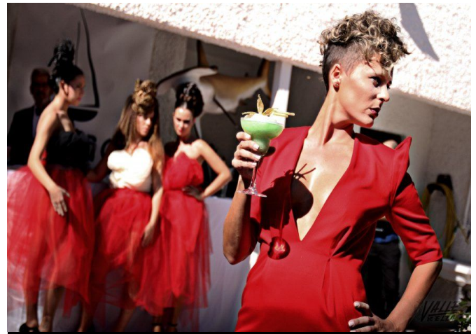
Los 19 modelos posaron en diferentes escenarios | Jesús Cruces.

En "The Opulence" se consiguió reflejar las nuevas tendencias a la perfección gracias a la colaboración de diferentes empresas que colaboraron con sus productos. Los peluqueros logran unos peinados que sorprenden gracias a los productos de alta calidad de Cotril.