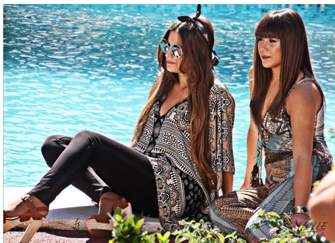
En "The Opulence" se mostraron las últimas novedades en moda, peluquería y diseño | Jesús Cruces.

El pub Isla Tabarca también participó en esta sesión fotográfica y ofreció una amplia variedad de cócteles a los asistentes.