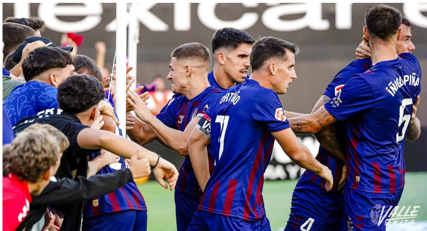
El Eldense celebra un gol en el Nuevo Pepico Amat | Nando Verdú.

El Eldense contaría con muchas opciones de eludir el descenso a Primera Federación si llega al mes de abril cerca de las posiciones de permanencia y vence en cuatro o cinco partidos a disputar contra rivales sucesivos como el Burgos, Cartagena, Sporting de Gijón, Racing de Ferrol y Córdoba.