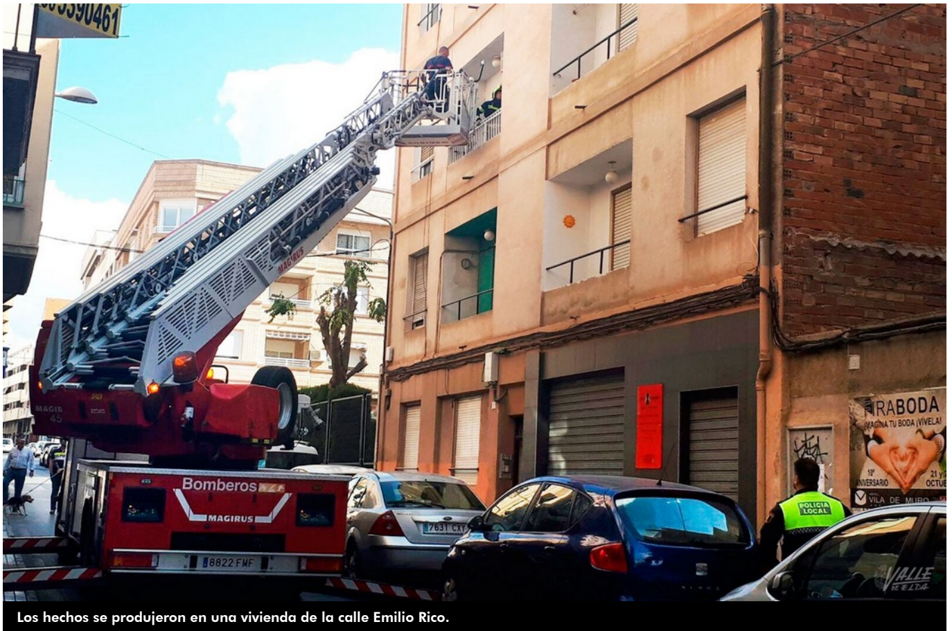
Los hechos se produjeron en una vivienda de la calle Emilio Rico.

El cadáver de un hombre fue encontrado tres días después de su muerte por causas naturales el pasado jueves sobre las 20 horas en su vivienda del segundo piso de un edificio de la calle Emilio Rico de Elda. Los bomberos tuvieron que acceder a la vivienda tras recibir la alerta de que este hombre, que vivía solo, podría haber muerto . Al lugar también acudieron agentes de la Policía Local de Elda y de la Policía Nacional. Al parecer no lo echaron en falta hasta tres días después de su muerte .