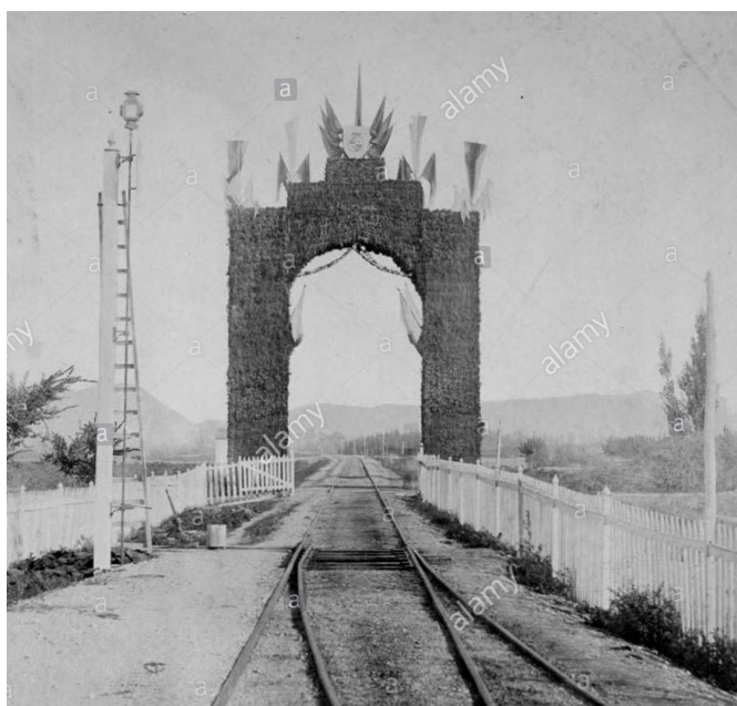
Arco triunfal conmemorativo levantado en Fuente la Higuera, con motivo de la inauguración del tramo Almansa-Alicante. Un arco de similares características fue el levantado en Elda para el mismo acontecimiento.

En aquel punto la villa de Elda erigió un arco triunfal , obra del maestro Francisco Coronel , flanqueado por cuatro banderas con los colores nacionales de España y decorado con otros emblemas y adornos, con una gran inscripción en la que se leía " Elda a su reina: a Isabel II, protectora de las artes ".