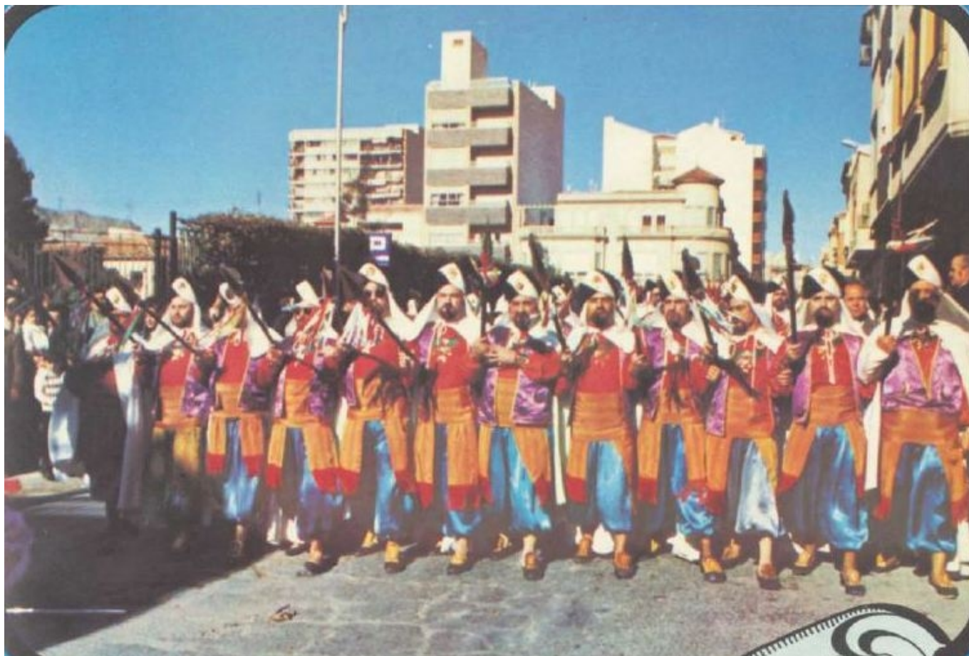
El primer desfile se realizó con los trajes oficiales

En 2024 celebramos el 75º aniversario de la construcción de la nueva ermita de San Antón, que vino a reemplazar a aquella otra vetusta ermita barroca que custodiaba el acceso a la villa de Elda desde el siglo XVII y que fue demolida hacia 1925 ante el estado de ruina que presentaba. Pero no se nos puede pasar de largo otra redonda conmemoración también de la Fiesta, o mejor dicho, de la Media Fiesta.