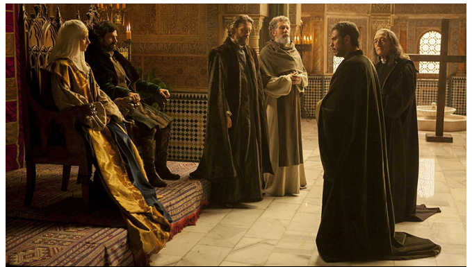
Secuencia de la serie "Isabel", emitida por RTVE, en la que los Reyes Católicos reciben a Cristóbal Colón para la firma de las Capitulaciones entre ambos que permitieron al marino arribar a las costas de las Indias.