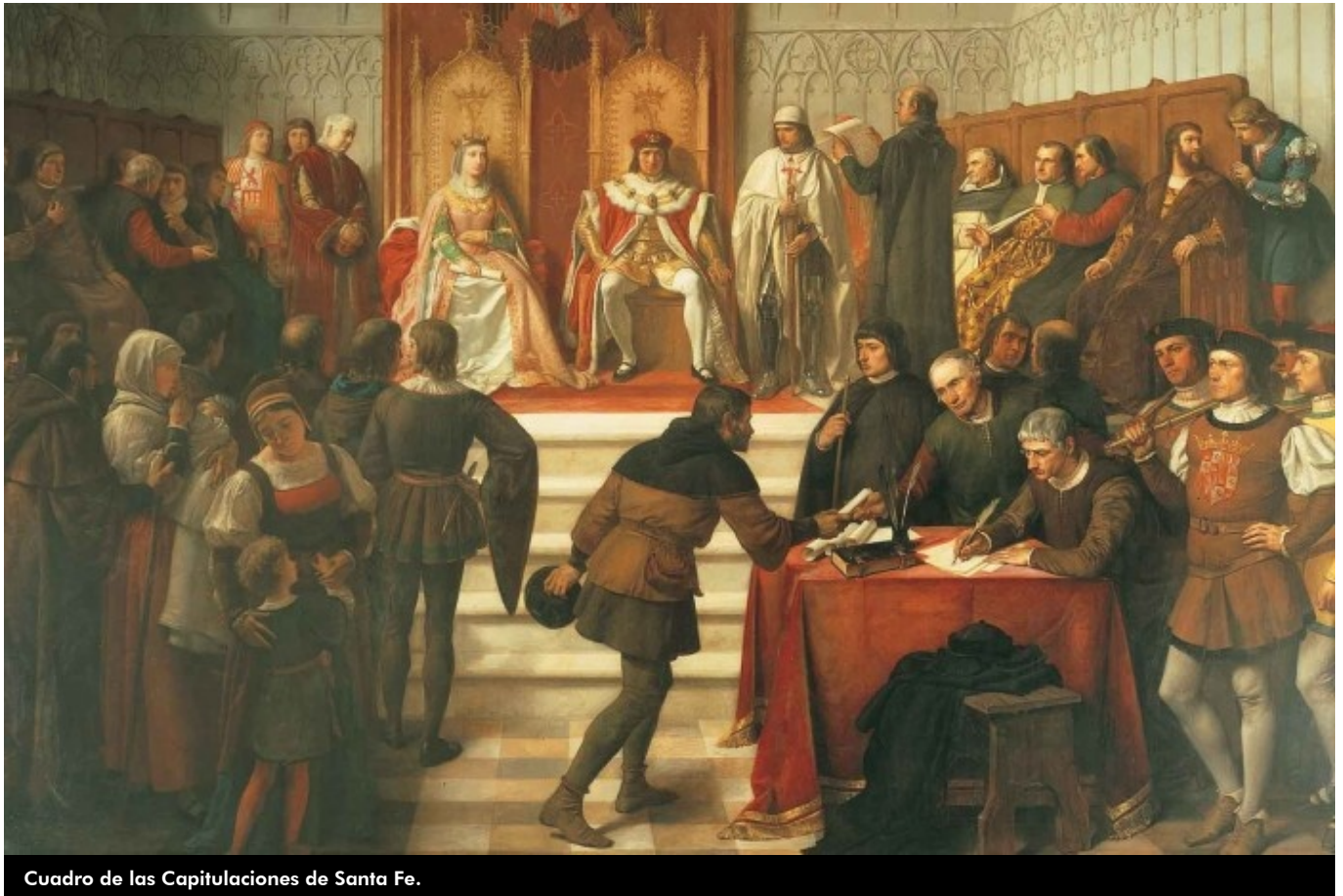
Cuadro de las Capitulaciones de Santa Fe.

Quizás sea un poco exagerado vincular la historia de Elda con la gesta colombina de la llegada, en octubre de 1492, de los tres navíos castellanos a las Indias Occidentales , como fueron llamadas las tierras posteriormente conocidas como América . Sin embargo, existe una relación, si no instrumental, sí formal o personal. Y este vínculo es Juan de Coloma , secretario personal que fue de Juan II de Aragón y, posteriormente, de los reyes Isabel de Castilla y Fernando II de Aragón . El tal Coloma será el fundador de un linaje familiar que ostentó la titularidad del condado de Elda entre 1577 y 1729.